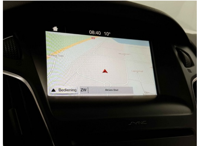
Navigatie of radio