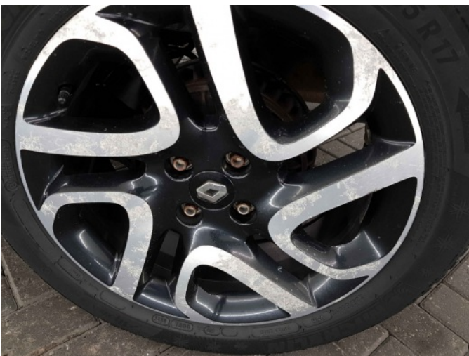
1. Velg achter - links