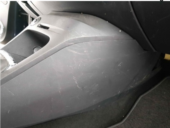
2. Diverse interieur schade