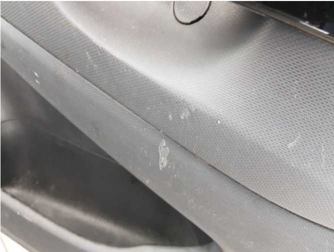
2. Diverse interieur schade