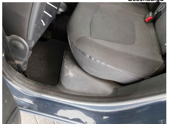
2. Diverse interieur schade