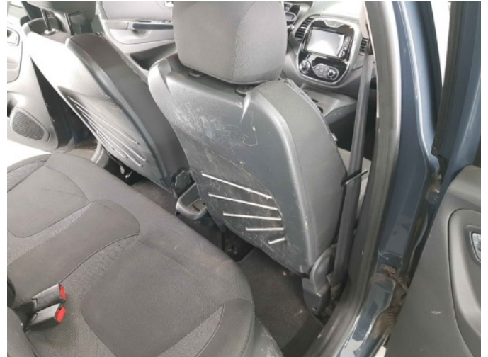
2. Diverse interieur schade