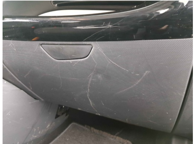
2. Diverse interieur schade