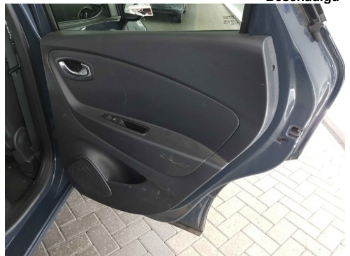
2. Diverse interieur schade