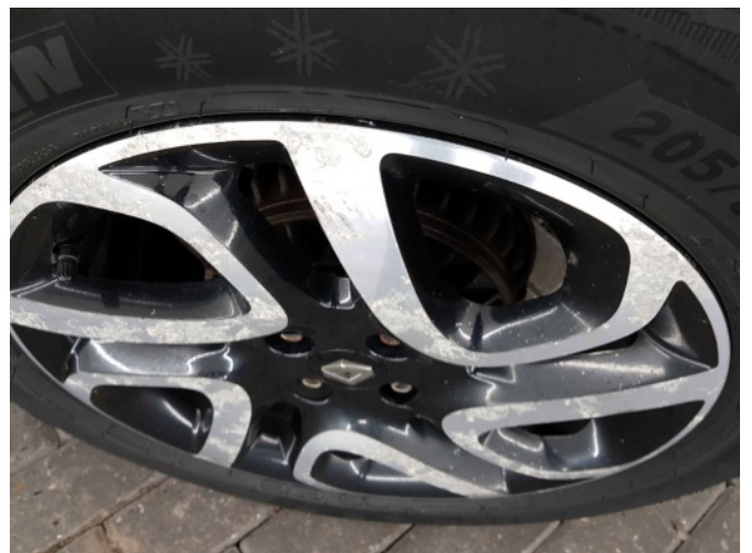
1. Velg achter - links