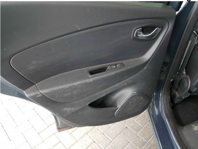
2. Diverse interieur schade