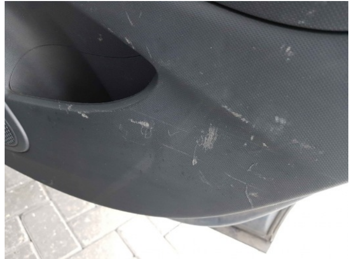
2. Diverse interieur schade