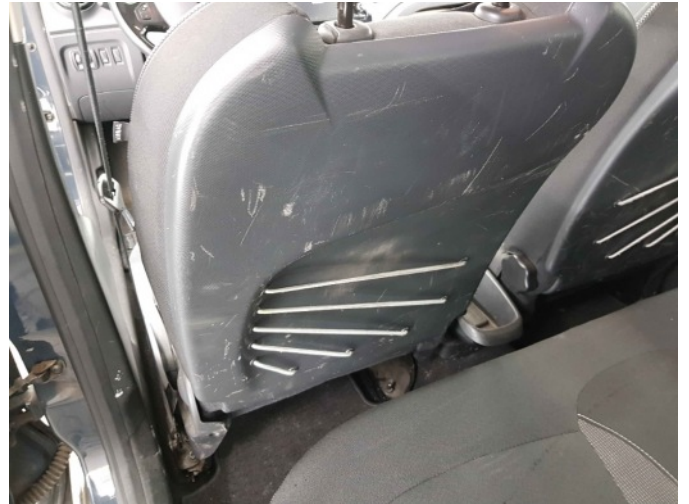
2. Diverse interieur schade