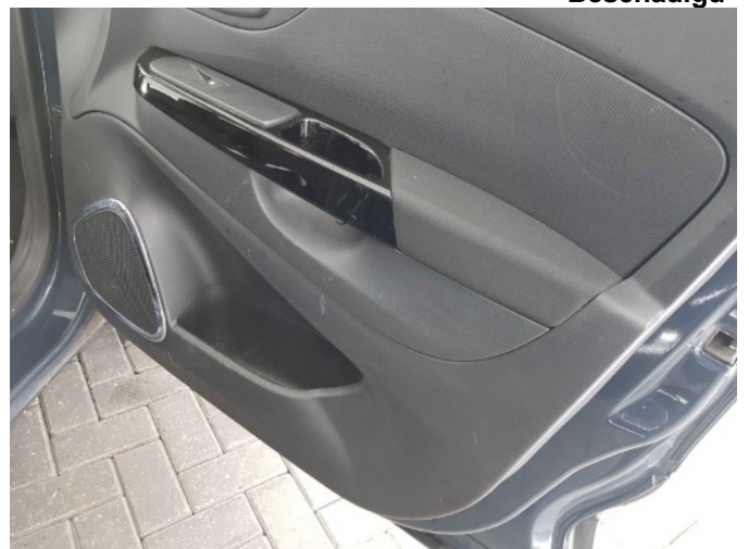
2. Diverse interieur schade