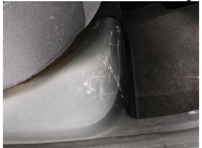
2. Diverse interieur schade