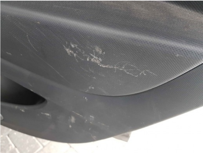
2. Diverse interieur schade