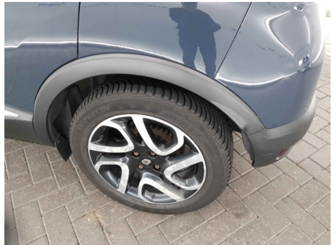
1. Velg achter - links