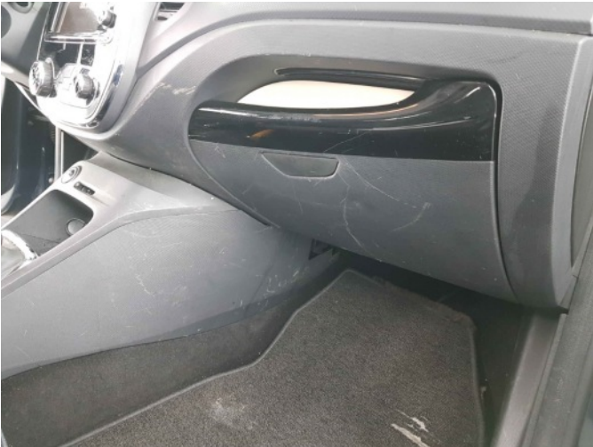
2. Diverse interieur schade