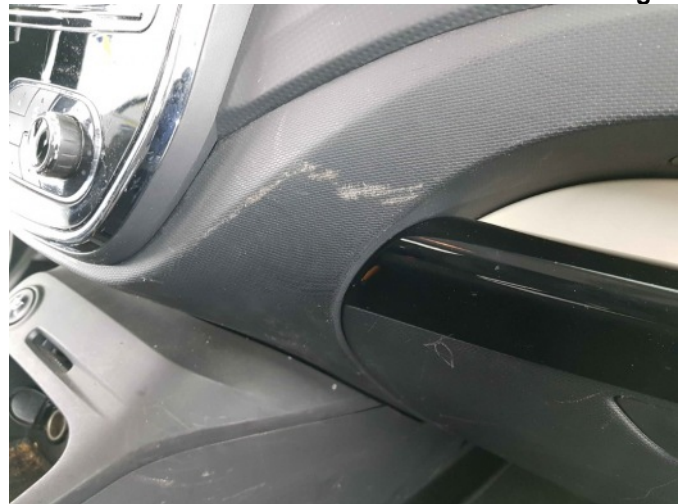
2. Diverse interieur schade