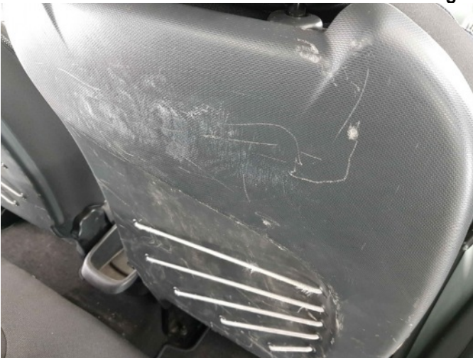
2. Diverse interieur schade