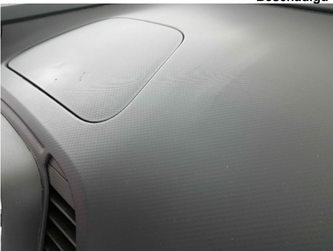
2. Diverse interieur schade