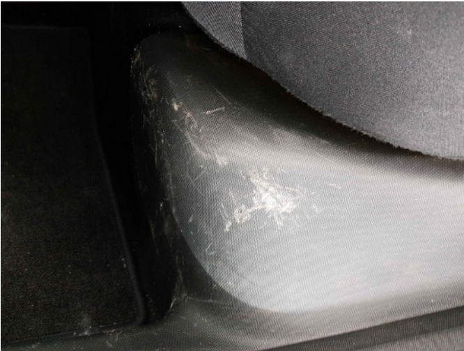
2. Diverse interieur schade