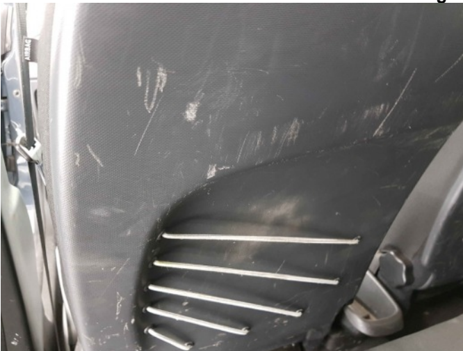
2. Diverse interieur schade