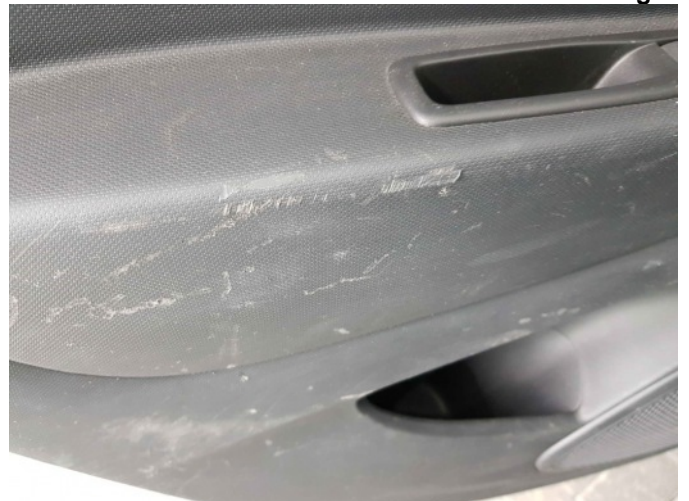
2. Diverse interieur schade