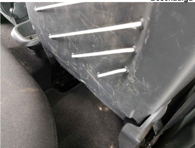
2. Diverse interieur schade