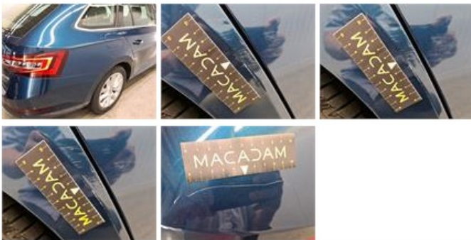
Deur A L, Kras(sen), Herstellen en spuiten (compleet)