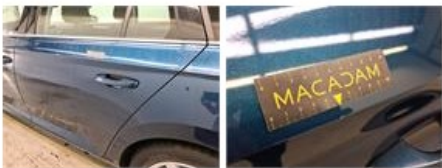
Deur A R, Kras(sen), Herstellen en spuiten (compleet)