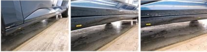
Scherf A R, Kras(sen), Herstellen en spuiten (compleet)