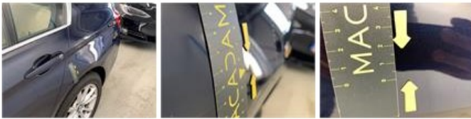
Scherf V R, Steenslag, Herstellen en spuiten (compleet)