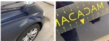
Deur A L, Deuk(en), Herstellen en spuiten (compleet)