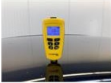
Scherf A L, Deuk(en), Herstellen en spuiten (compleet)