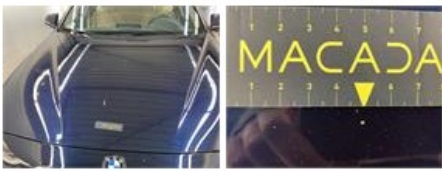
Dak, Hagelschade, Uitdeuken zonder spuiten (hagelschade)