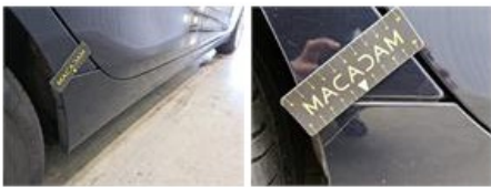
Bumper V, Kras(sen), Herstellen en spuiten (compleet)