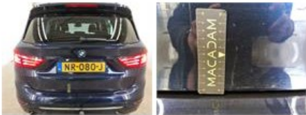
Carrosserie, Lakdiktemeting, Aanvaardbaar