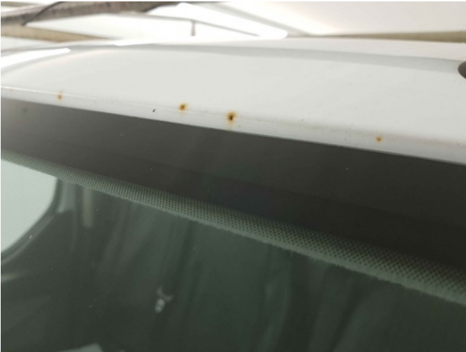
1. dak roest