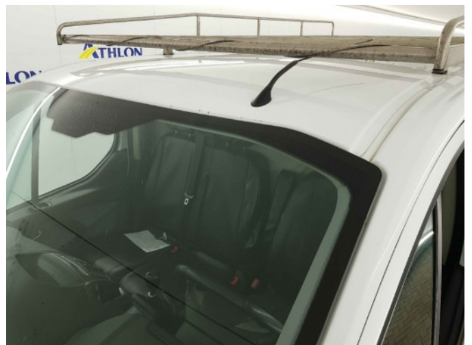
1. dak roest