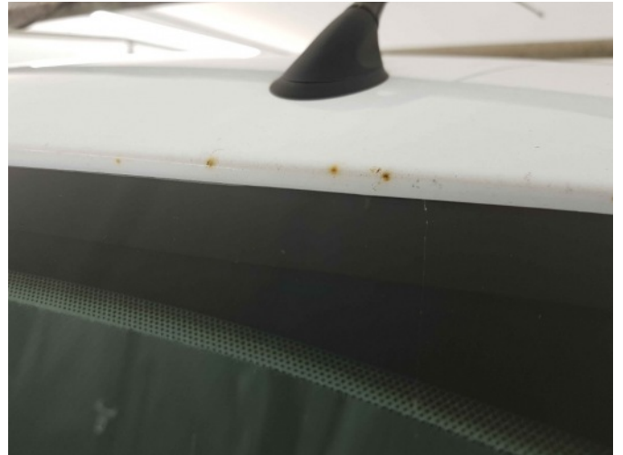
1. dak roest