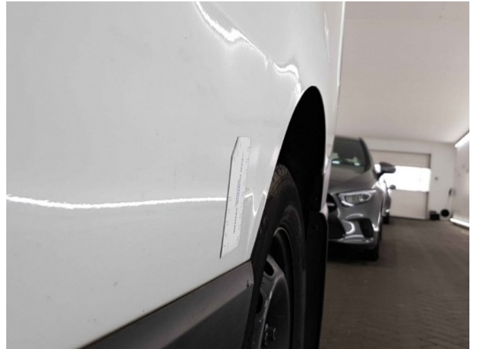
3. Zijwand - achter - Links