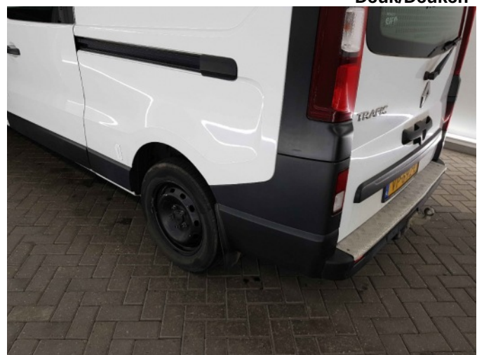
3. Zijwand - achter - Links