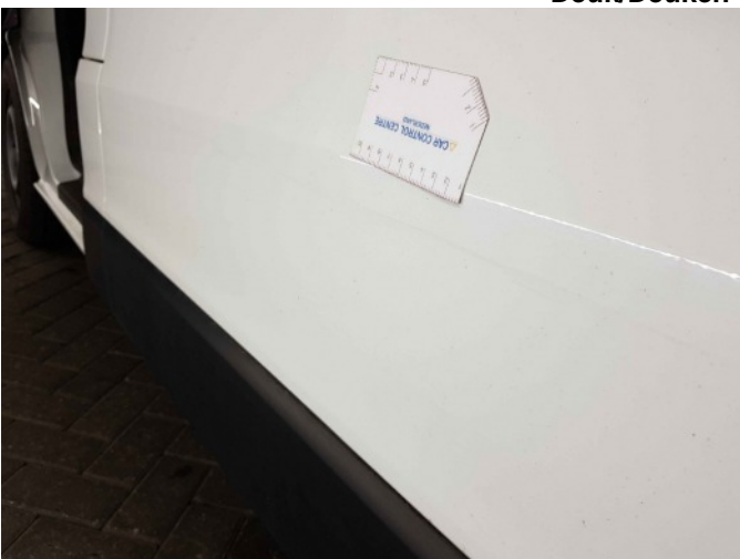
3. Zijwand - achter - Links