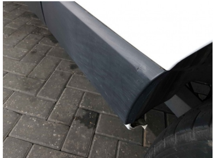
3. Zijwand - achter - Links