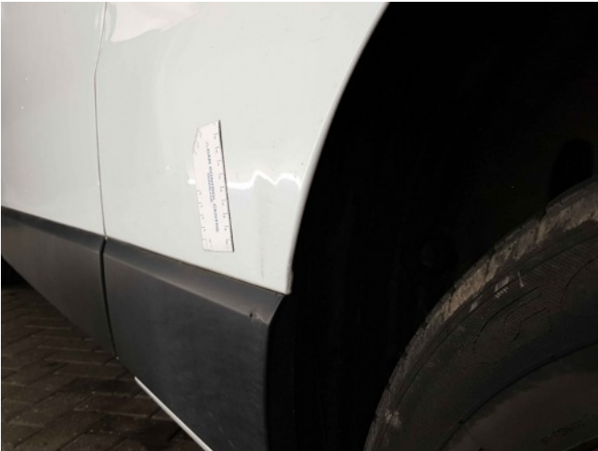
3. Zijwand - achter - Links