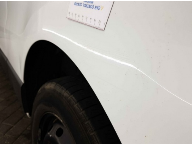
3. Zijwand - achter - Links