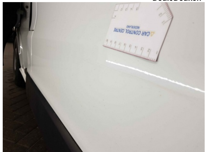
3. Zijwand - achter - Links