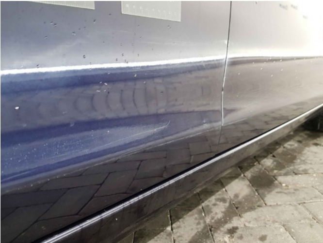
1. Portier achter - rechts