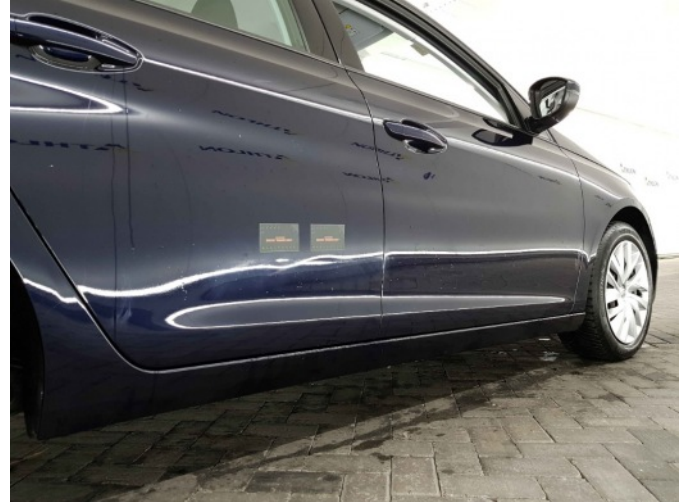
1. Portier achter - rechts