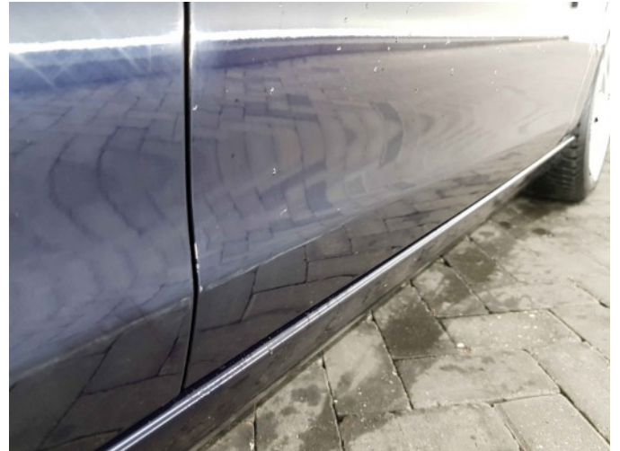
1. Portier achter - rechts