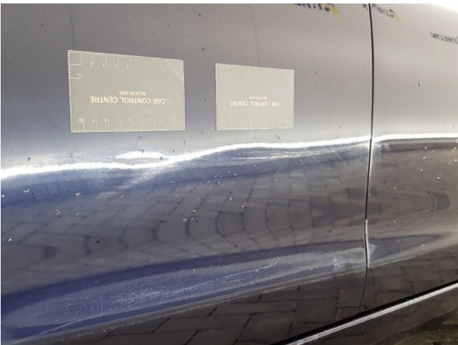
1. Portier achter - rechts