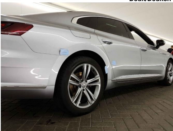
2. Zijwand - achter - rechts