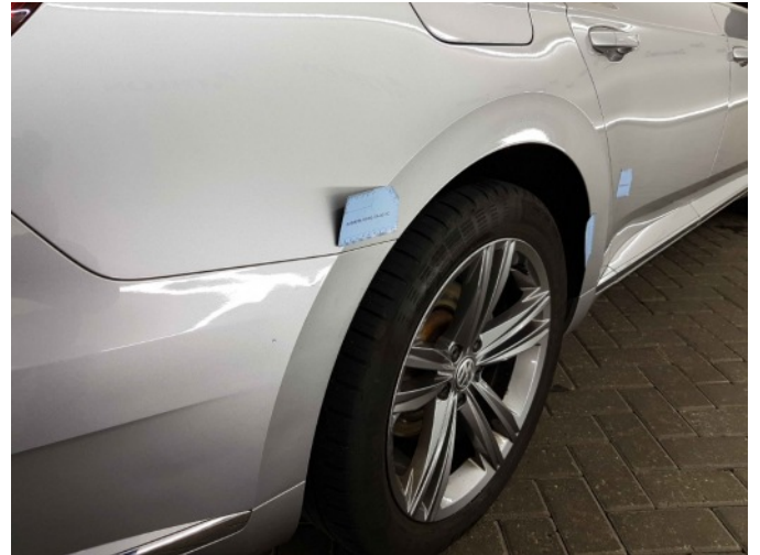
2. Zijwand - achter - rechts