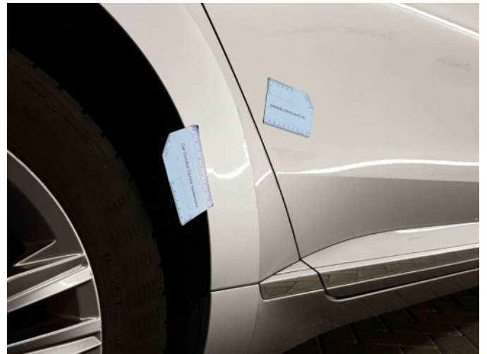
2. Zijwand - achter - rechts