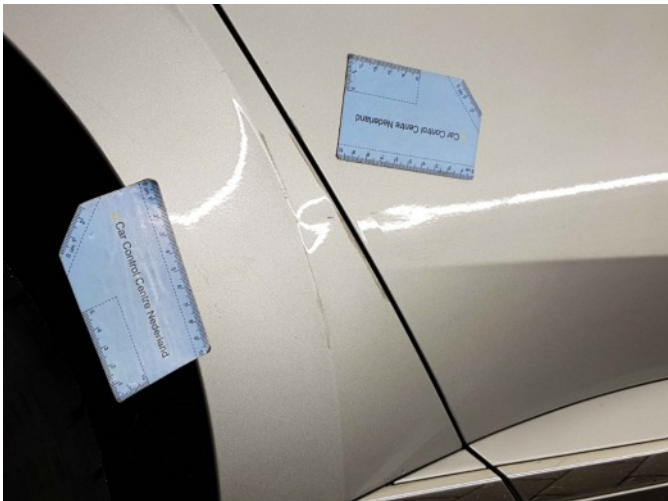
2. Zijwand - achter - rechts