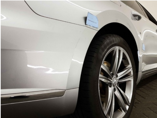
2. Zijwand - achter - rechts