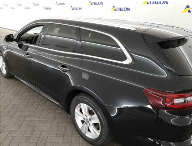
2. Zijwand - achter - Links