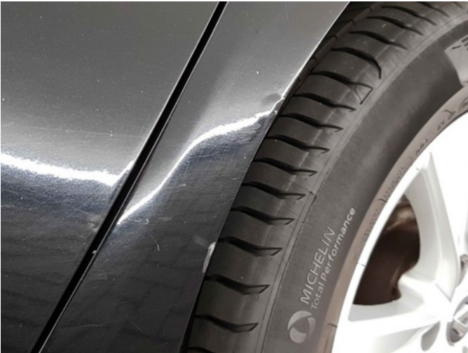
2. Zijwand - achter - Links