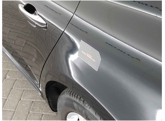
2. Zijwand - achter - Links