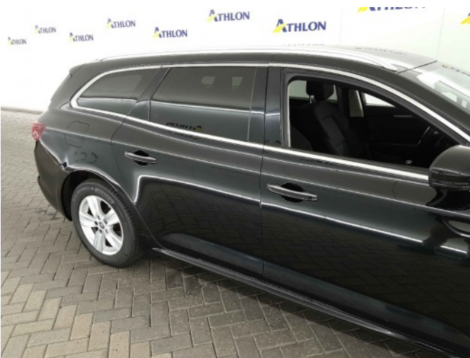
1. Dorpel - rechts