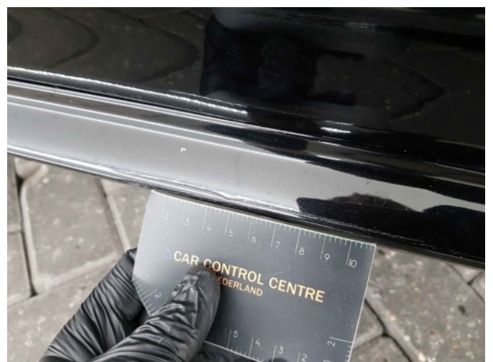
1. Dorpel - rechts