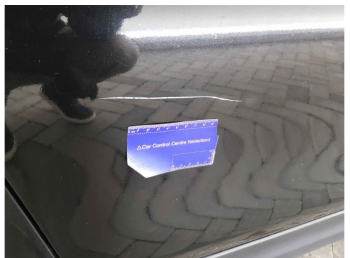
1. Portier voor - rechts