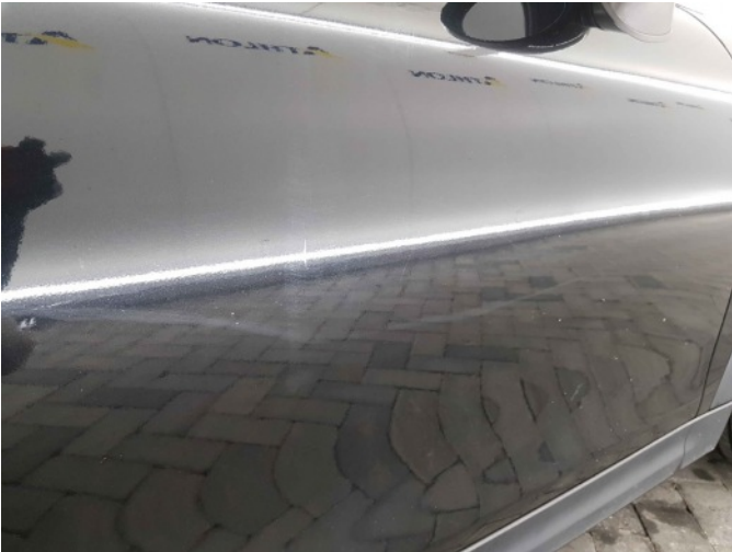
1. Portier voor - rechts