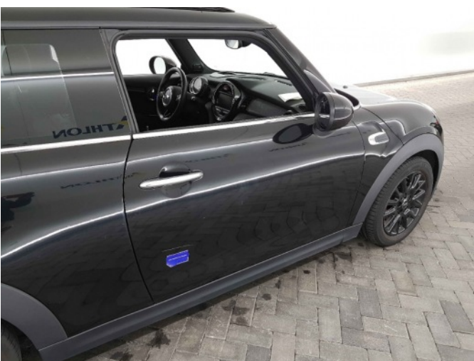
1. Portier voor - rechts