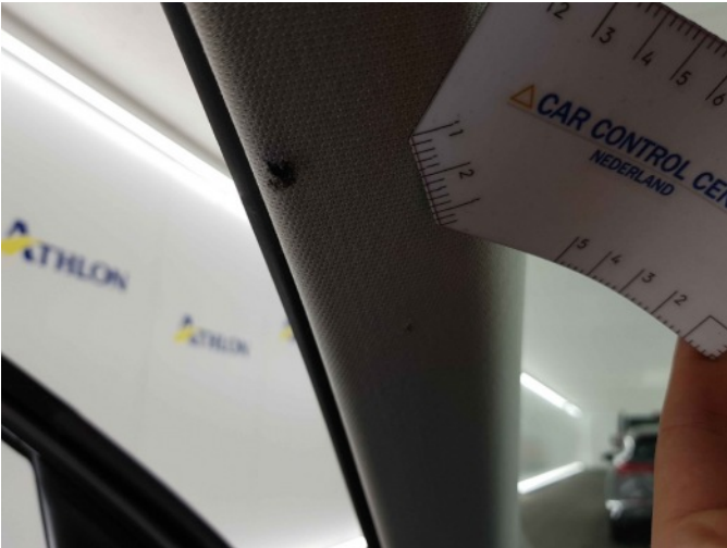
1. Bekleding / beklede panelen