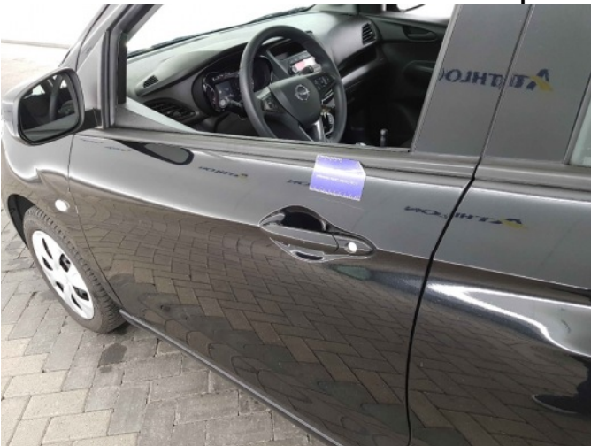
2. Portier voor - links