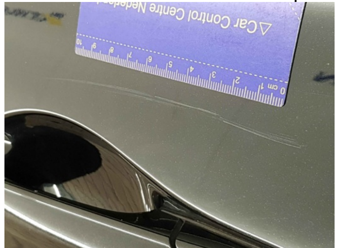
2. Portier voor - links