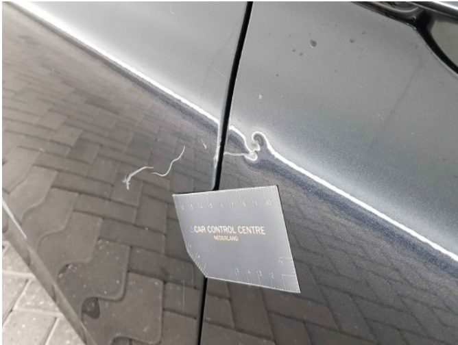
2. Portier voor - rechts