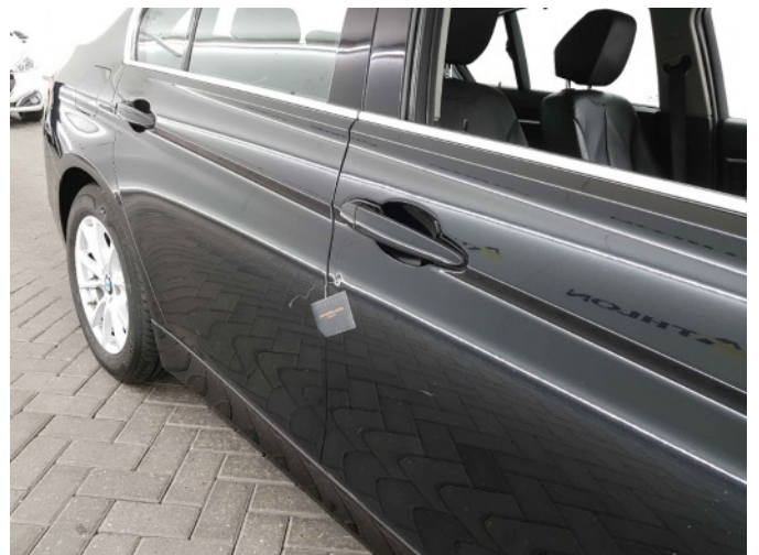
2. Portier voor - rechts