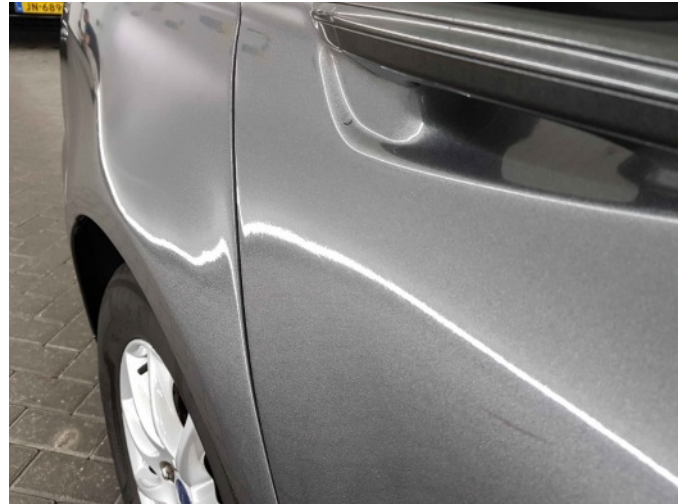
2. Slecht herstel