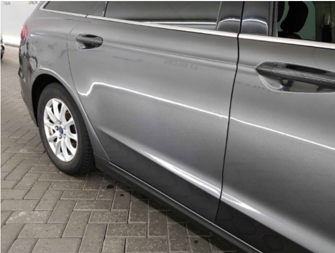
2. Slecht herstel