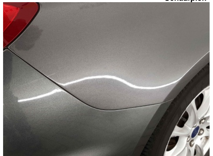
2. Slecht herstel