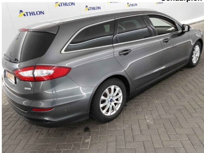
2. Slecht herstel