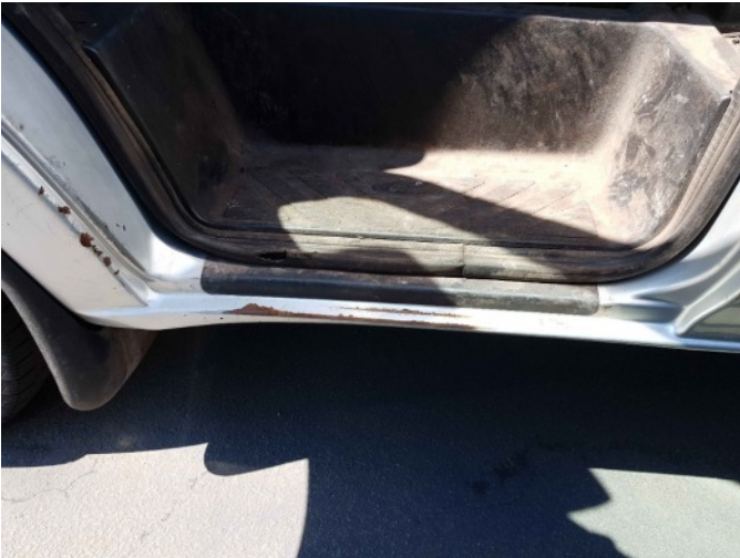
5. L dorpel roestig