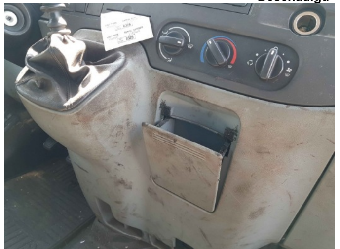
9. Diverse interieur bevuild