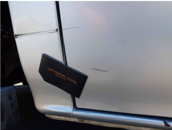
2. Zijwand - achter - rechts