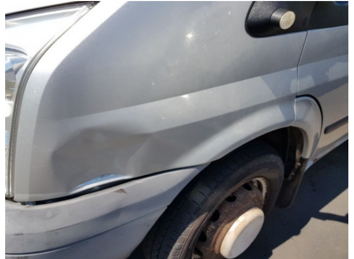
4. Spatbord voor- links