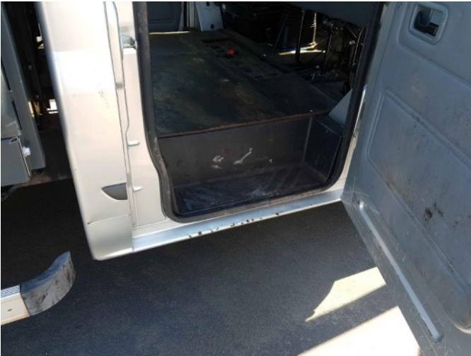
7. R dorpel roestig