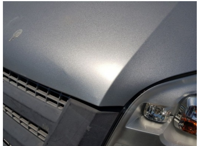
4. Spatbord voor- links