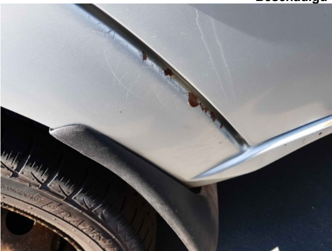
5. L dorpel roestig