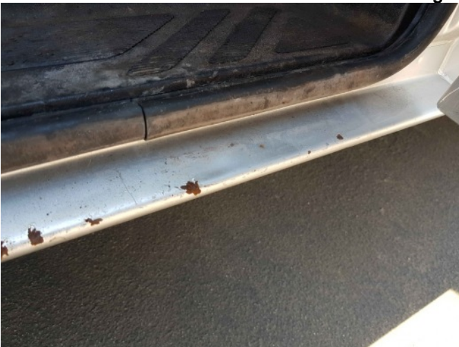
7. R dorpel roestig