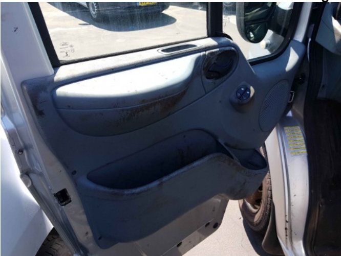
9. Diverse interieur bevuild