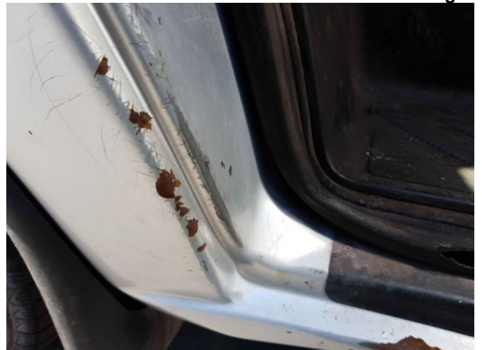
5. L dorpel roestig