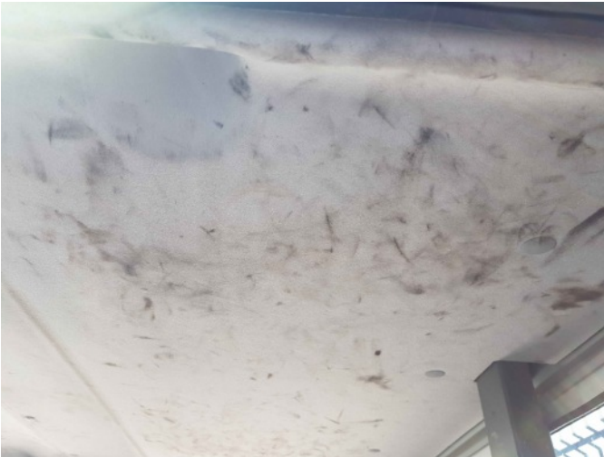
9. Diverse interieur bevuild