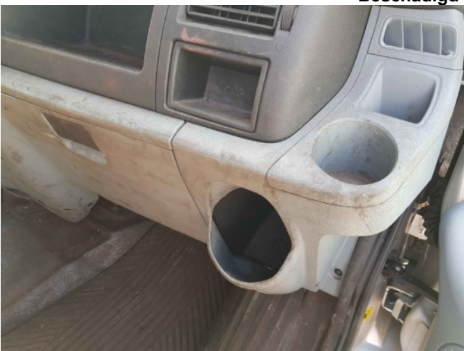
9. Diverse interieur bevuild