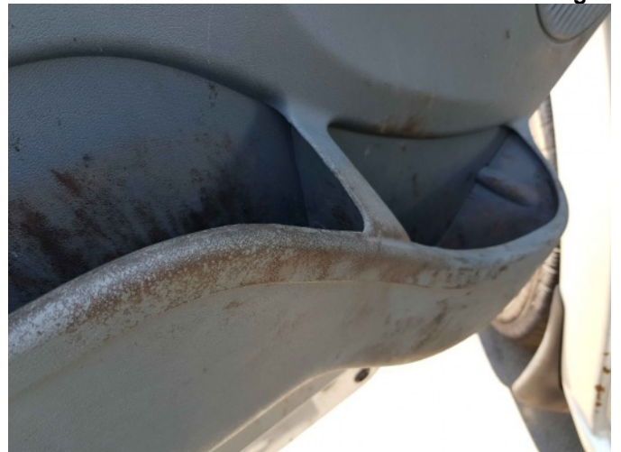
9. Diverse interieur bevuild