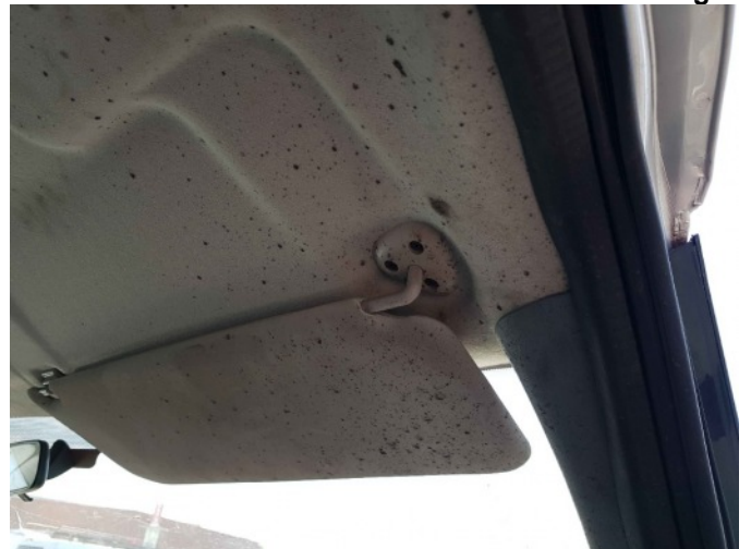
9. Diverse interieur bevuild