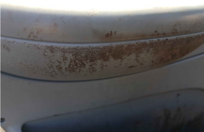
9. Diverse interieur bevuild