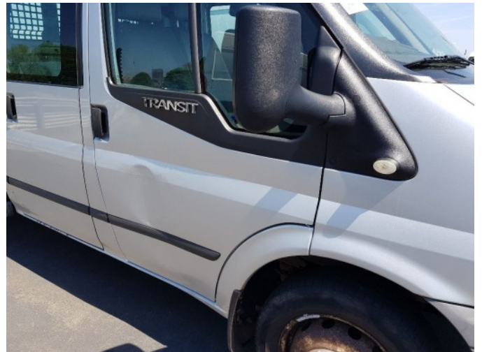
3. Portier voor - rechts