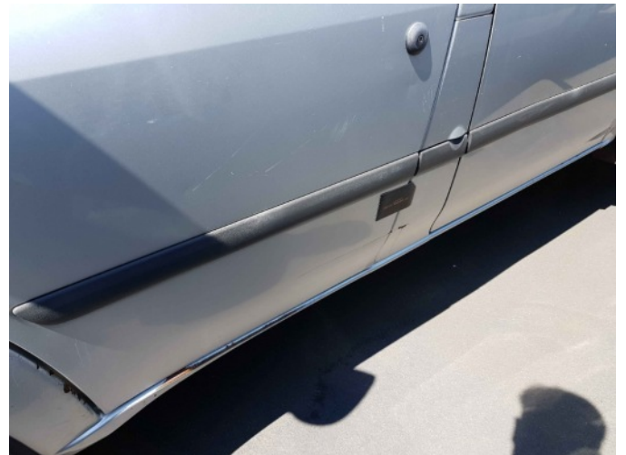
1. Portier voor - links