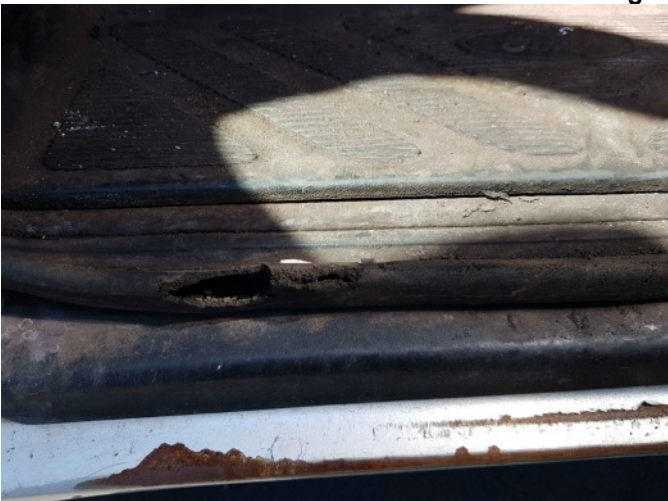
5. L dorpel roestig