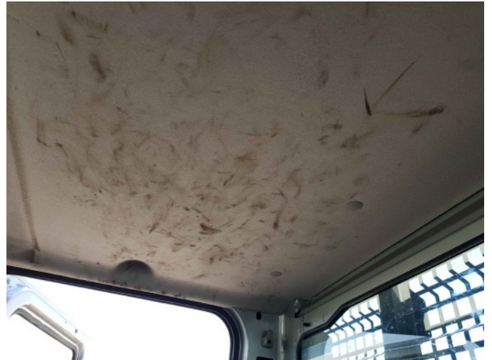
9. Diverse interieur bevuild