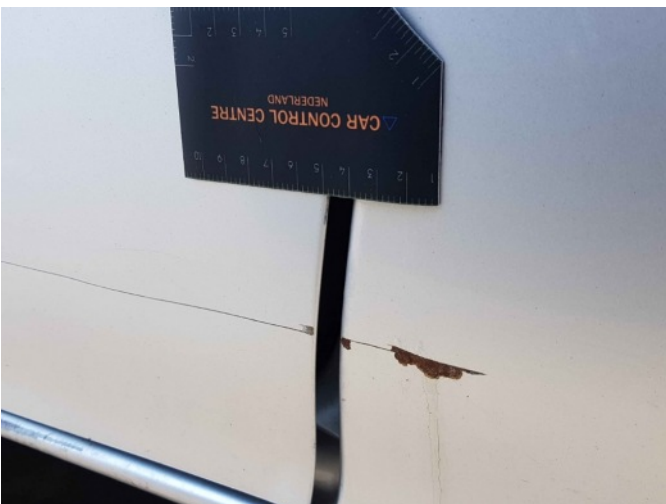
1. Portier voor - links