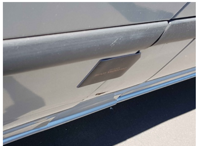
1. Portier voor - links