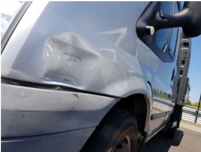
4. Spatbord voor- links