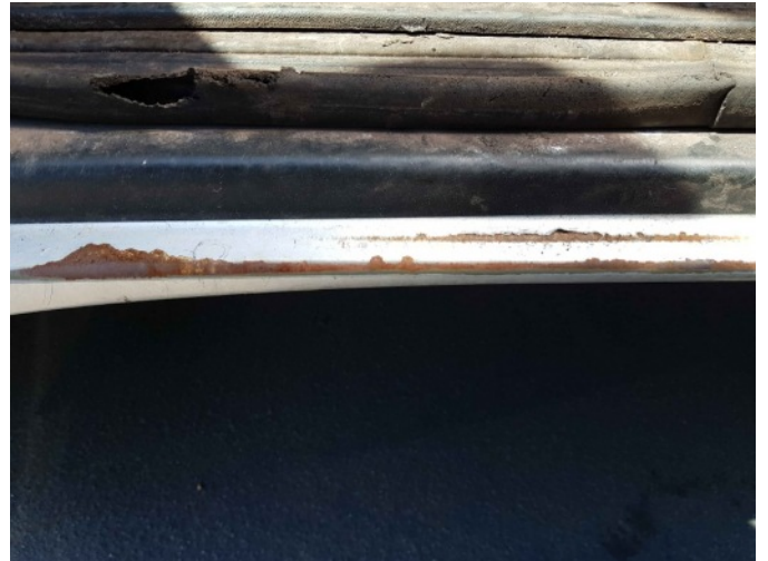
5. L dorpel roestig