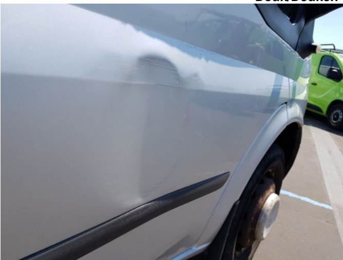
3. Portier voor - rechts