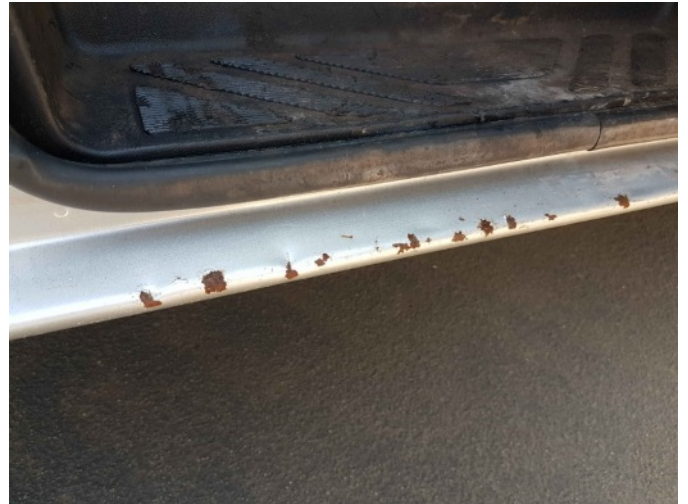
7. R dorpel roestig