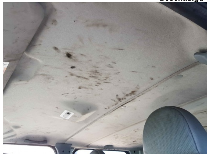
9. Diverse interieur bevuild