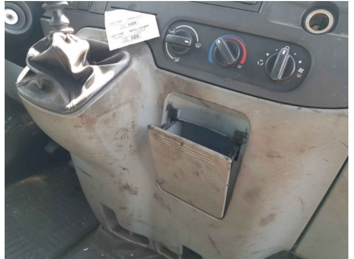
9. Diverse interieur bevuild