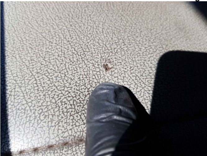
9. Diverse interieur bevuild