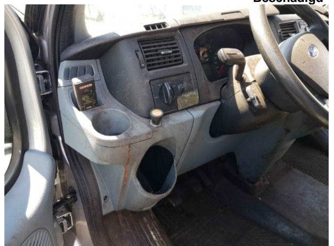
9. Diverse interieur bevuild