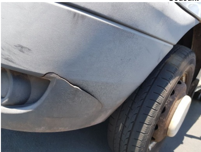
4. Spatbord voor- links