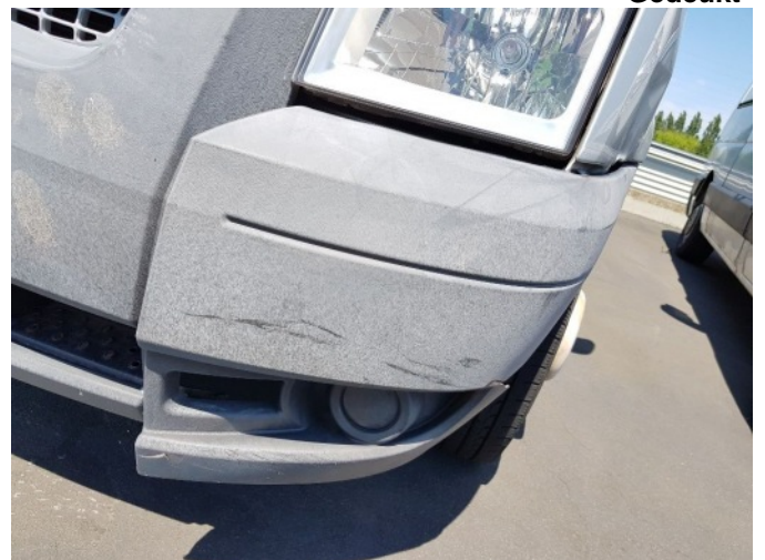
4. Spatbord voor- links