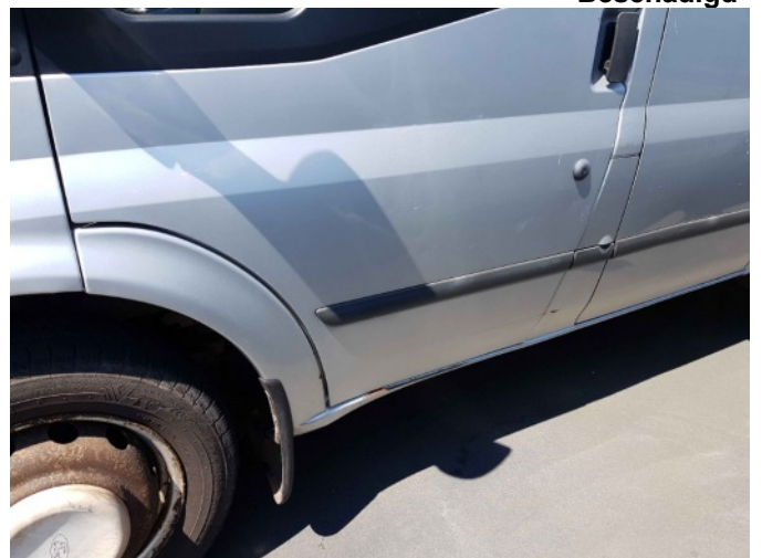
5. L dorpel roestig