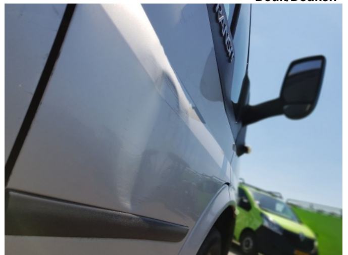
3. Portier voor - rechts