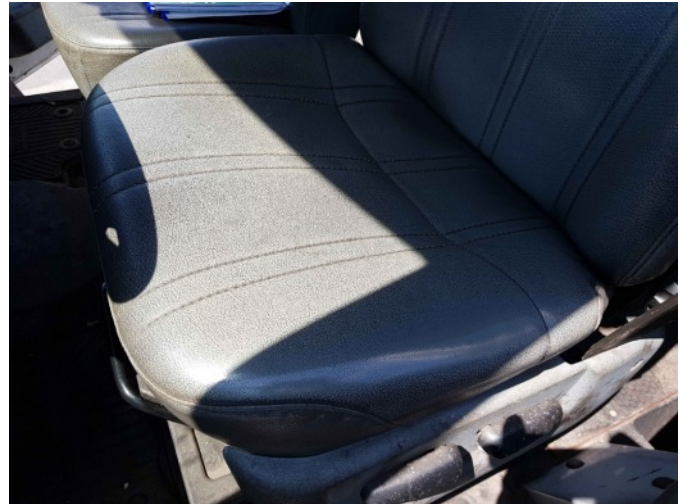
9. Diverse interieur bevuild