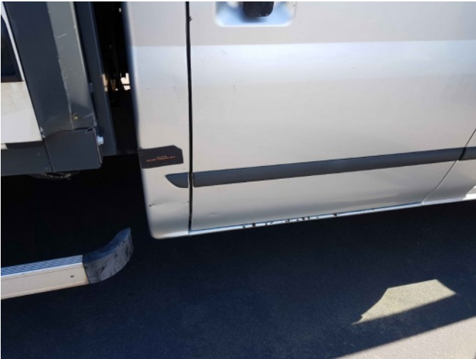
2. Zijwand - achter - rechts