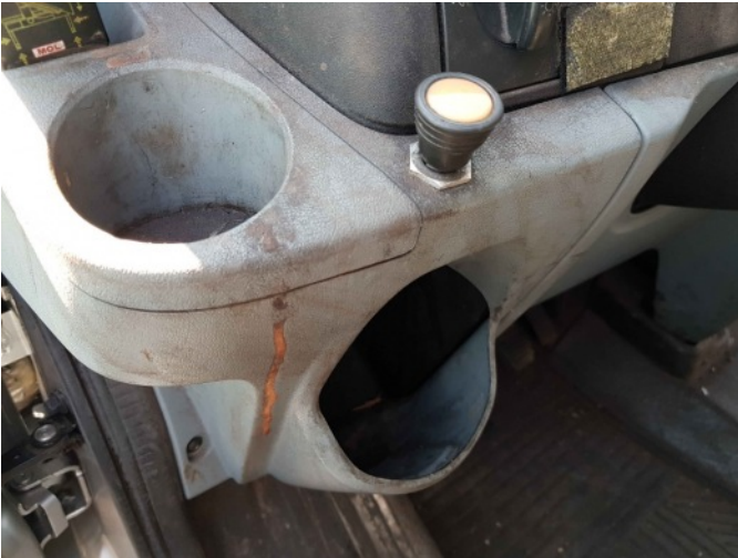
9. Diverse interieur bevuild