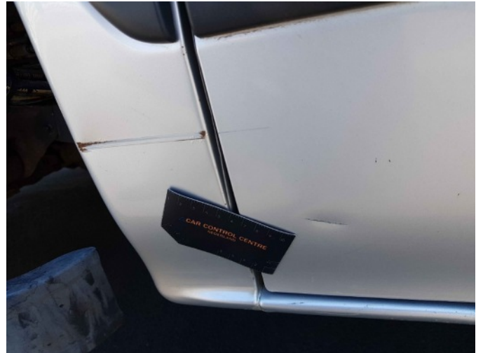
2. Zijwand - achter - rechts