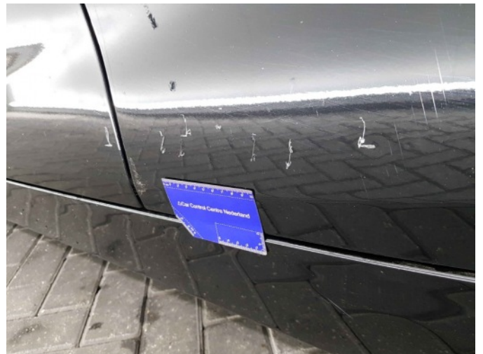
1. Portier voor - links