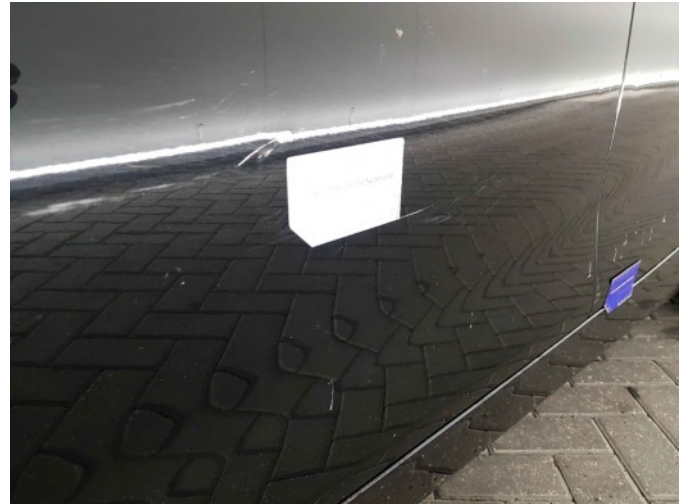
1. Portier voor - links