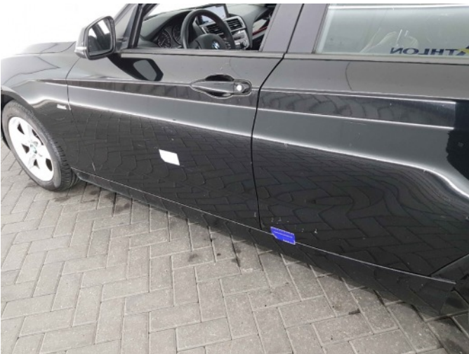
1. Portier voor - links