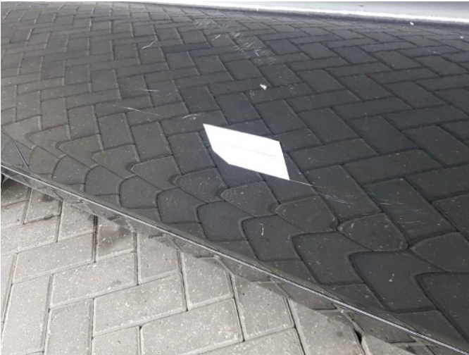
1. Portier voor - links