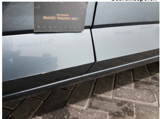
6. Schade hiker