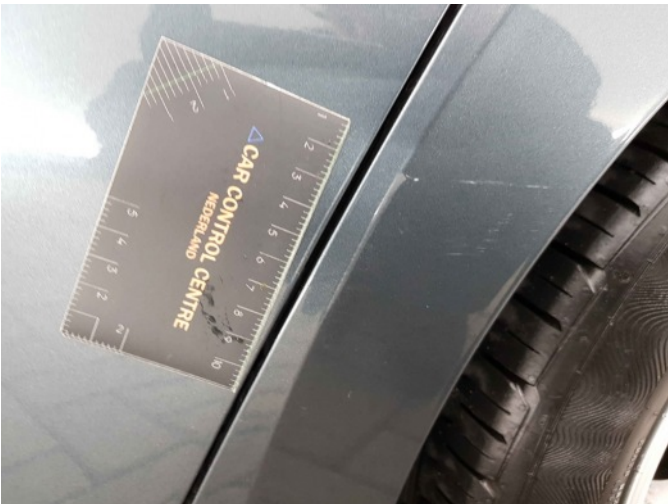
4. Zijwand - achter - Links