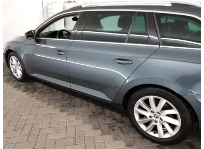
4. Zijwand - achter - Links