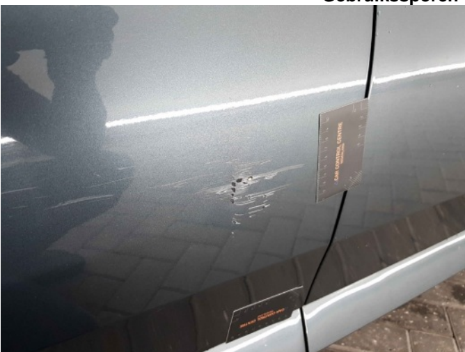
6. Schade hiker