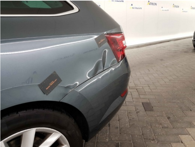
3. Zijwand - achter - Links