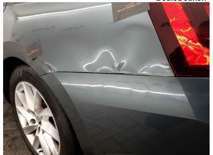
3. Zijwand - achter - Links