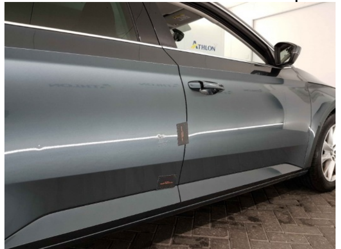
6. Schade hiker