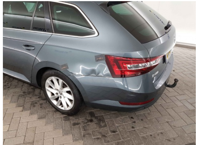
3. Zijwand - achter - Links