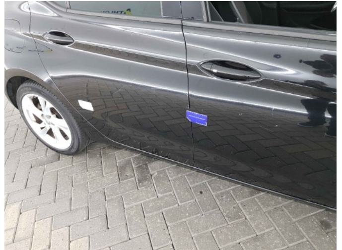
2. Portier achter - rechts