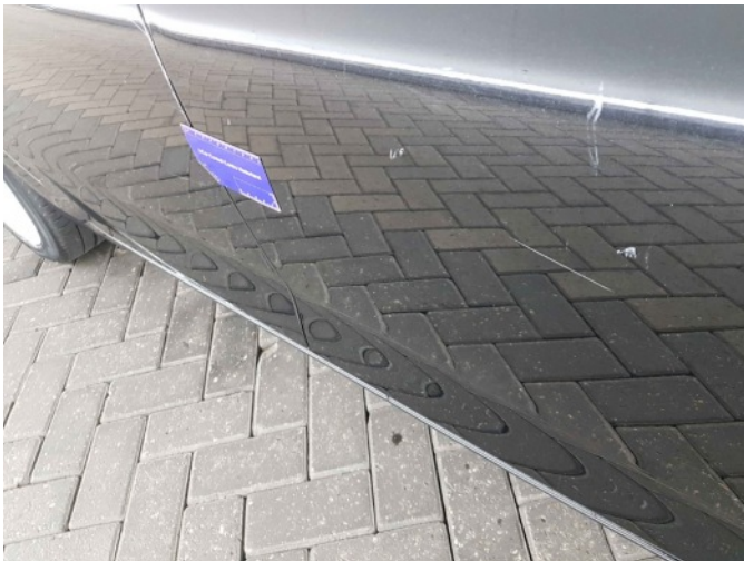
2. Portier achter - rechts