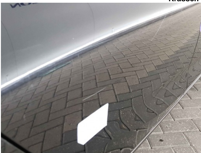
2. Portier achter - rechts