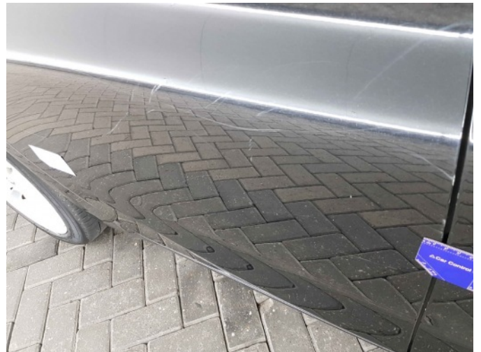
2. Portier achter - rechts