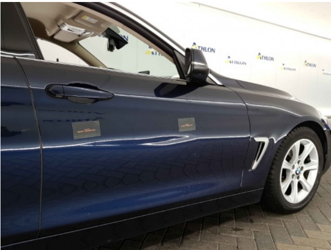
2. Portier voor - rechts