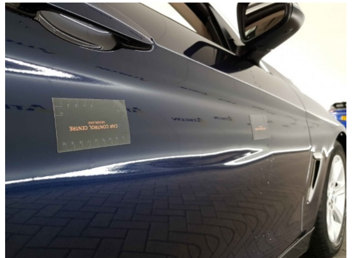
2. Portier voor - rechts