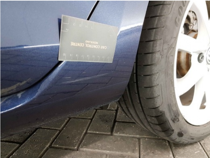
1. Portier achter - links