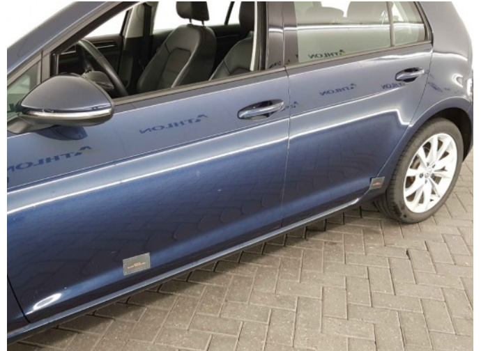
1. Portier achter - links