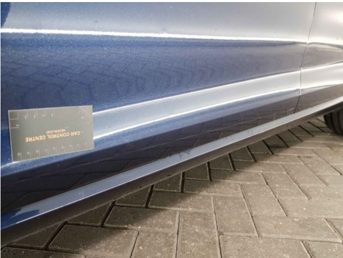
1. Portier achter - links