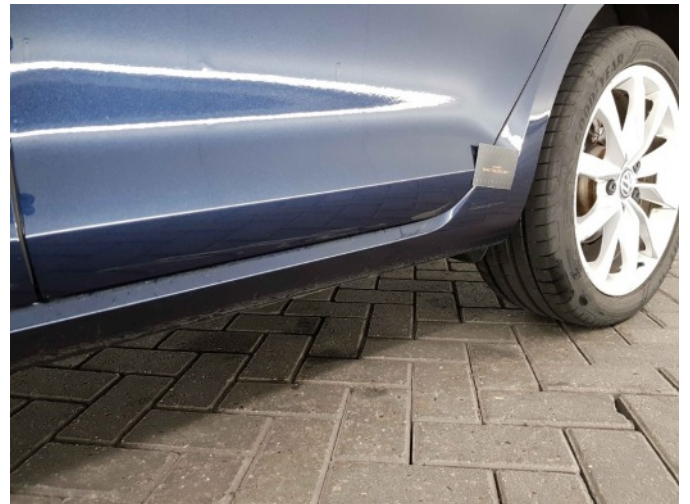
1. Portier achter - links