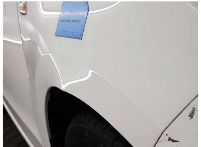
1. Spatbord voor- rechts