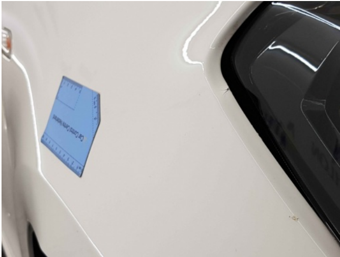
1. Spatbord voor- rechts