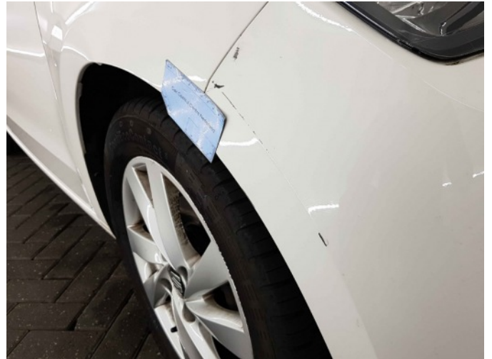
1. Spatbord voor- rechts