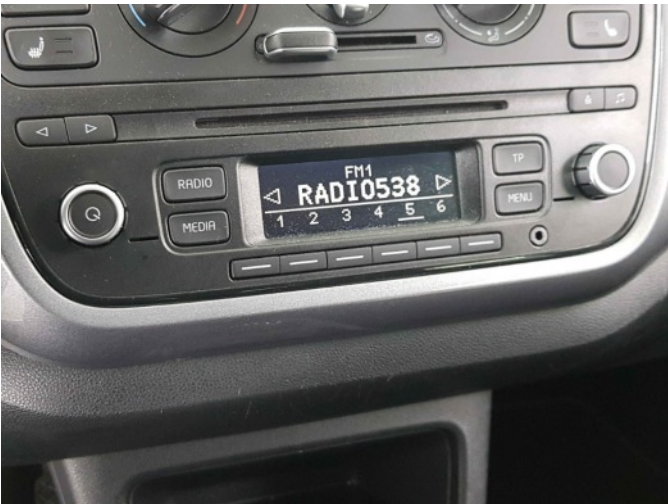
Navigatie of radio