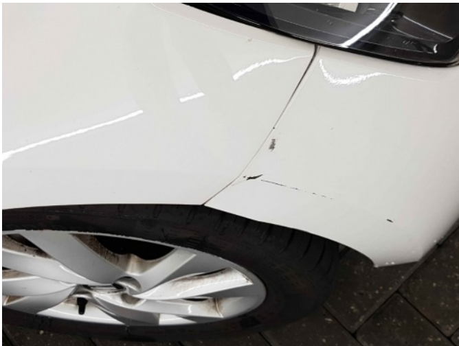
1. Spatbord voor- rechts