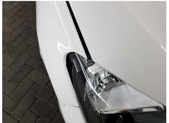
1. Spatbord voor- rechts