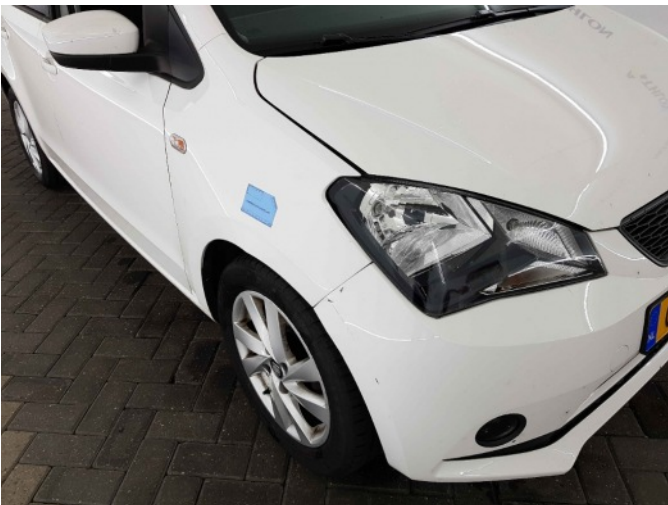
1. Spatbord voor- rechts