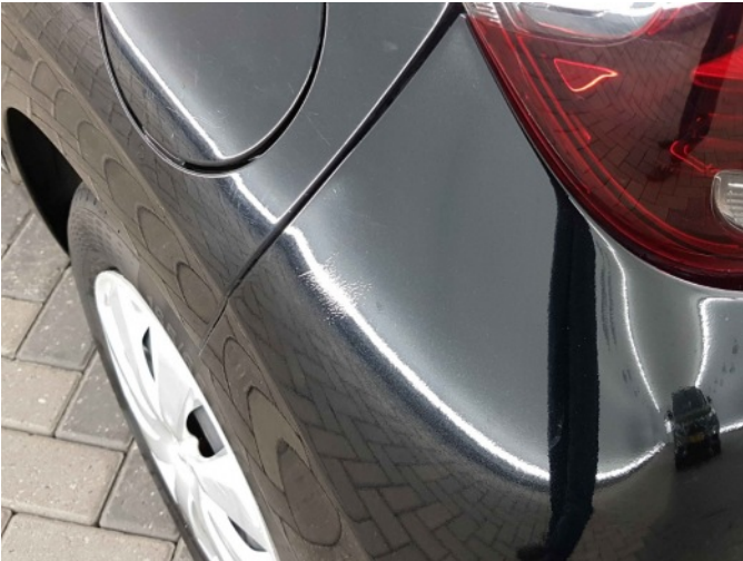
2. Slecht herstel