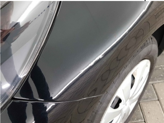
2. Slecht herstel