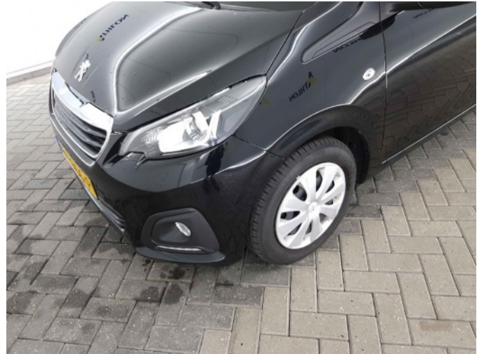
2. Slecht herstel