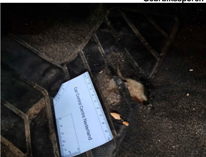
4. bestuurders tapijt