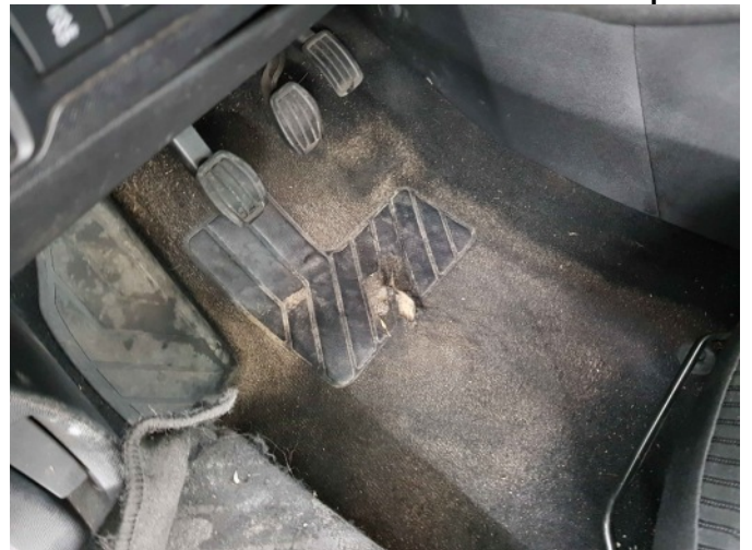
4. bestuurders tapijt