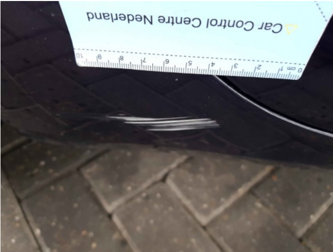
2. Dorpel - rechts