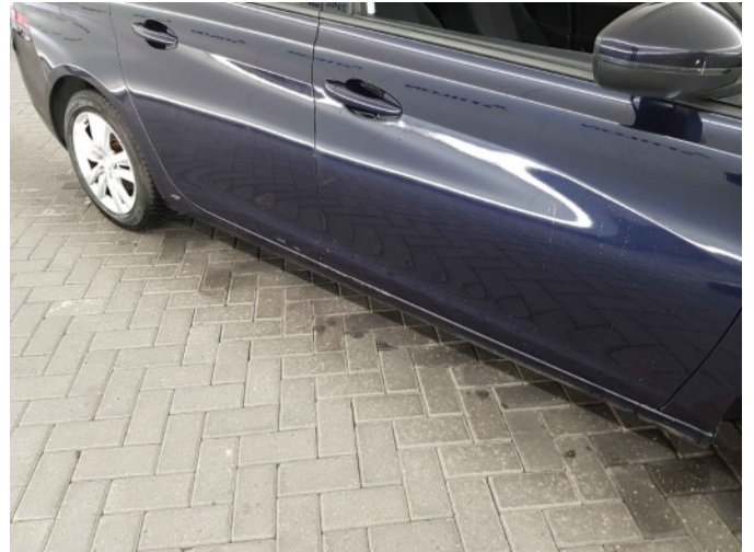
2. Dorpel - rechts