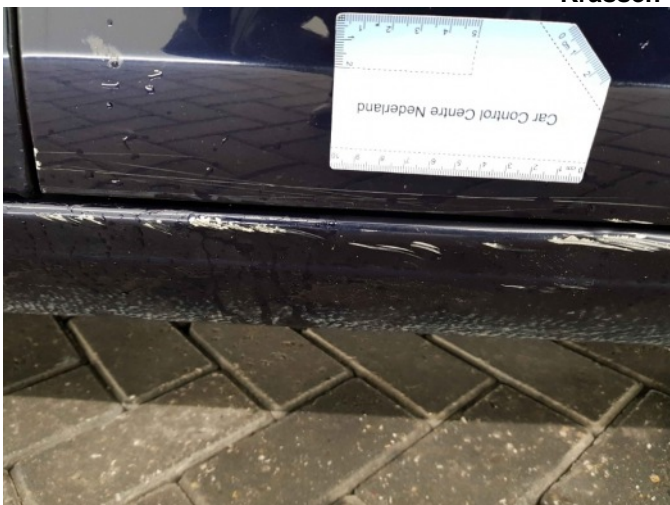
2. Dorpel - rechts