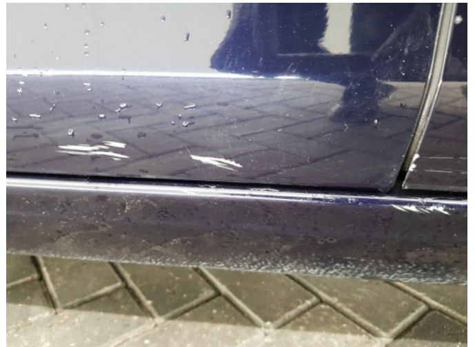
2. Dorpel - rechts