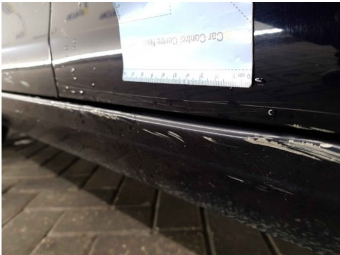
2. Dorpel - rechts