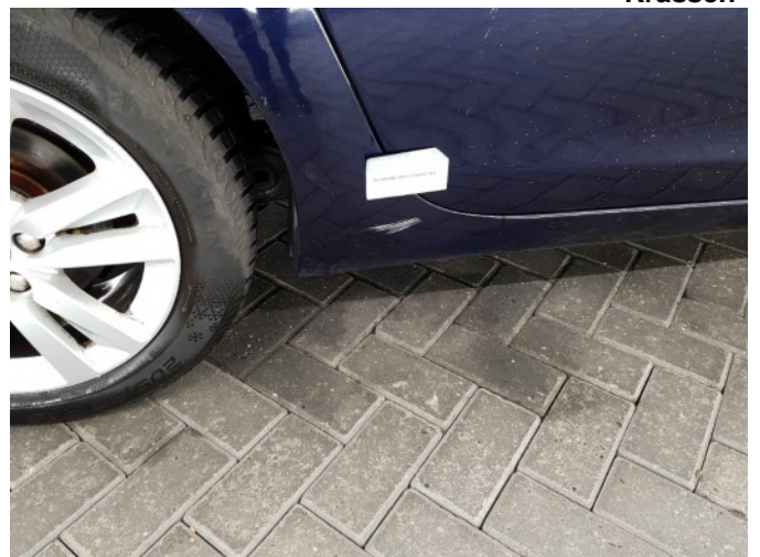
2. Dorpel - rechts