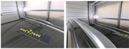
Scherf A L, Kras(sen), Herstellen en spuiten (compleet)