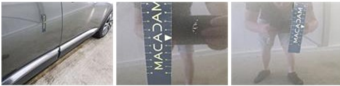
Deur A L, Kras(sen), Herstellen en spuiten (compleet)