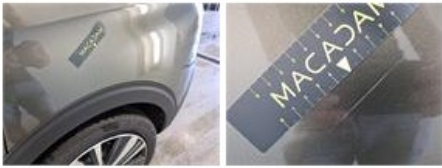
Deur V R, Kras(sen), Polijsten