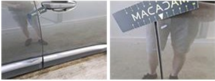
Deur A R, Kras(sen), Herstellen en spuiten (compleet)