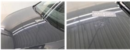
Dak, Kras(sen), Polijsten