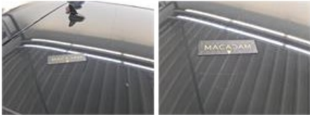
Bumper A, Kras(sen), Polijsten