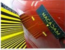
Scherf A L, Deuk(en) en kras(sen), Herstellen en spuiten (compleet)