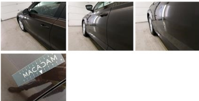
Deur V R, Deuk(en), Herstellen en spuiten (compleet)