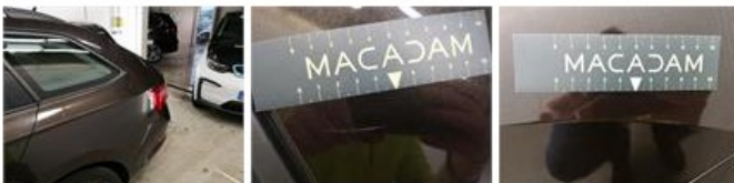
Bumper A, Kras(sen), Herstellen en spuiten (compleet)