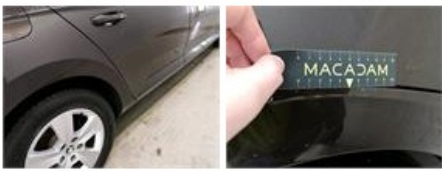
Deur A L, Deuk(en) en kras(sen), Herstellen en spuiten (compleet)