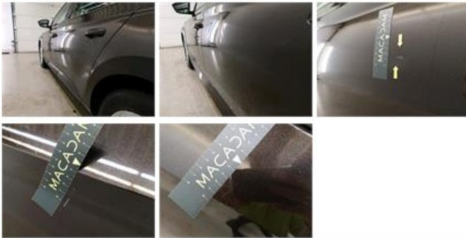
Scherf V L, Deuk(en) en kras(sen), Herstellen en spuiten (compleet)