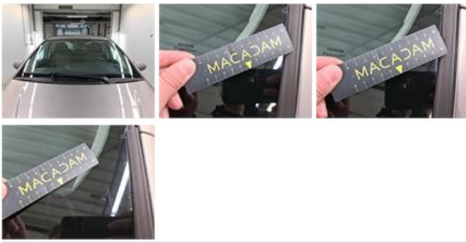
Deur A R, Deuk(en), Herstellen en spuiten (compleet)