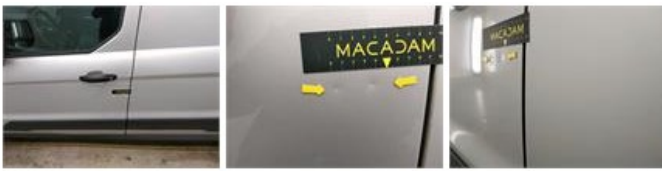
Deur V R, Kras(sen), Herstellen en spuiten (compleet)