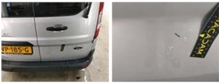
Scherp V L, Deuk(en) en kras(sen), Herstellen en spuiten (compleet)