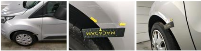
Bumper V, Kras(sen), Herstellen en spuiten (compleet)