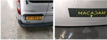
Bumper A, Kras(sen), Vervangen