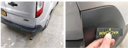
Scherf V R, Kras(sen), Herstellen en spuiten (compleet)