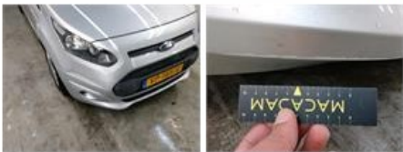
Contactsleutel, Ontbreekt, Vervangen