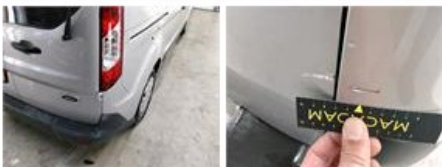
Schuifdeur R, Deuk(en) en kras(sen), Herstellen en spuiten (compleet)