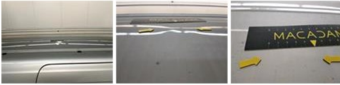
Scherp A L, Deuk(en) en kras(sen), Vervangen en spuiten