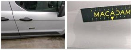
Dak, Deuk(en) en kras(sen), Herstellen en spuiten (compleet)