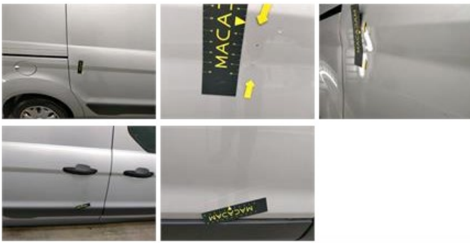
Achterdeur L, Kras(sen), Herstellen en spuiten (compleet)