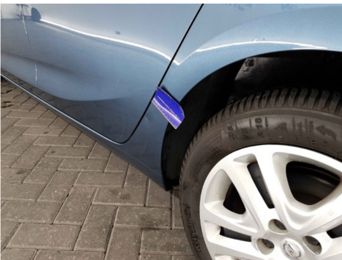
1. Zijwand - achter - Links