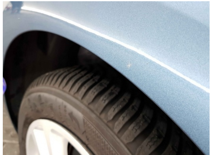
1. Zijwand - achter - Links