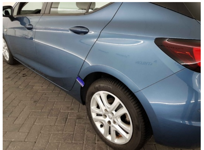
1. Zijwand - achter - Links