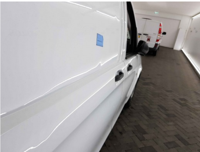
1. Portier achter - rechts