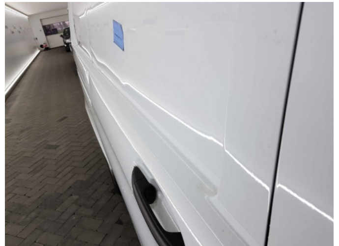
1. Portier achter - rechts