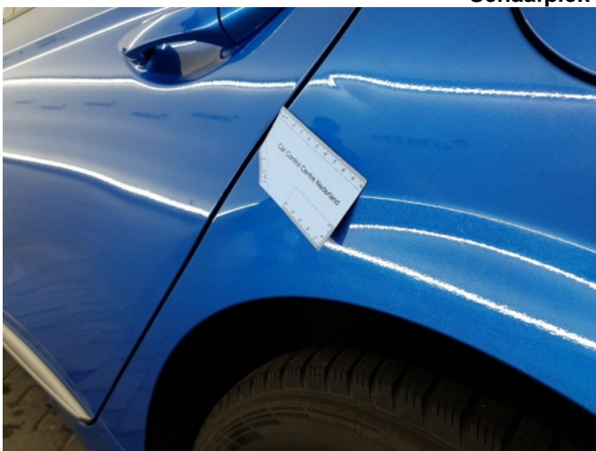
2. Zijwand - achter - Links