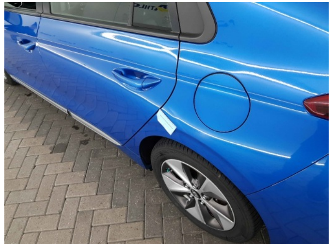
2. Zijwand - achter - Links