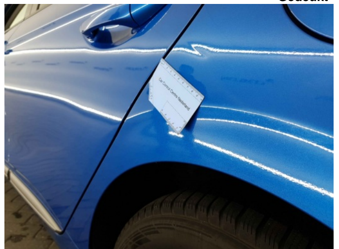
2. Zijwand - achter - Links