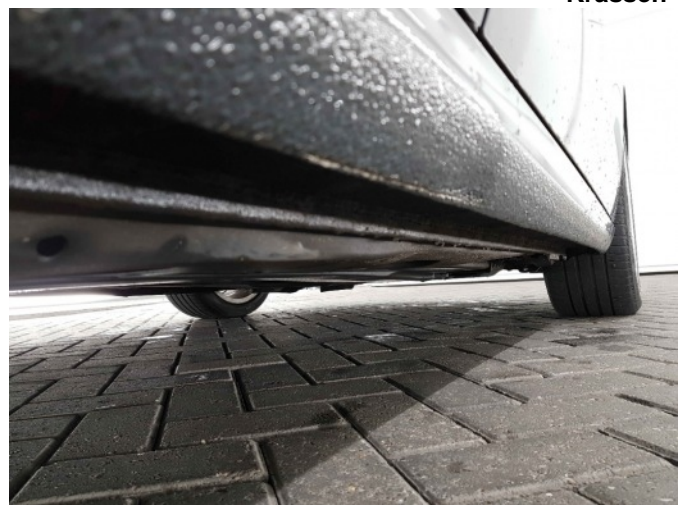
2. Dorpel - rechts