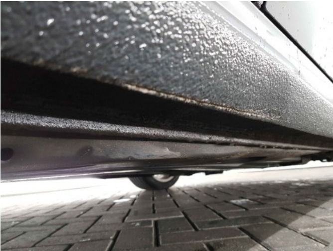
2. Dorpel - rechts