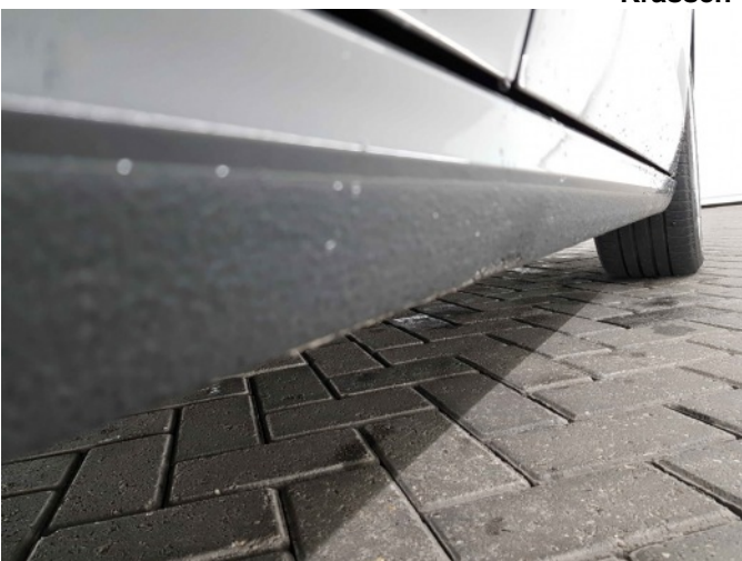
2. Dorpel - rechts