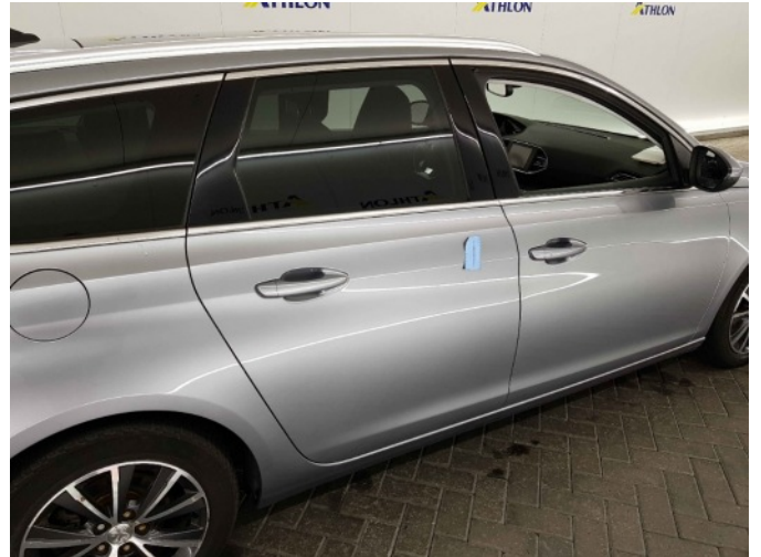
1. Portier achter - rechts