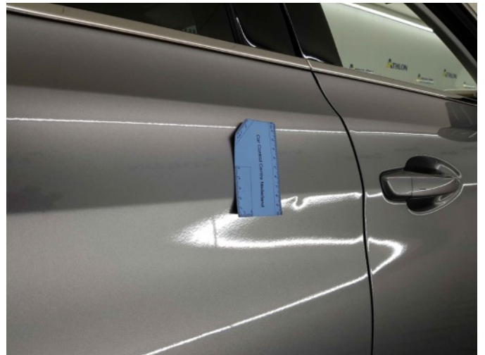
1. Portier achter - rechts