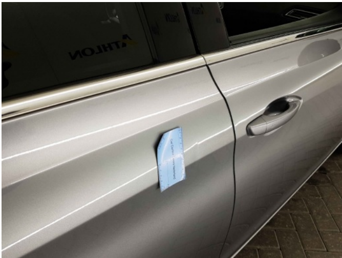
1. Portier achter - rechts