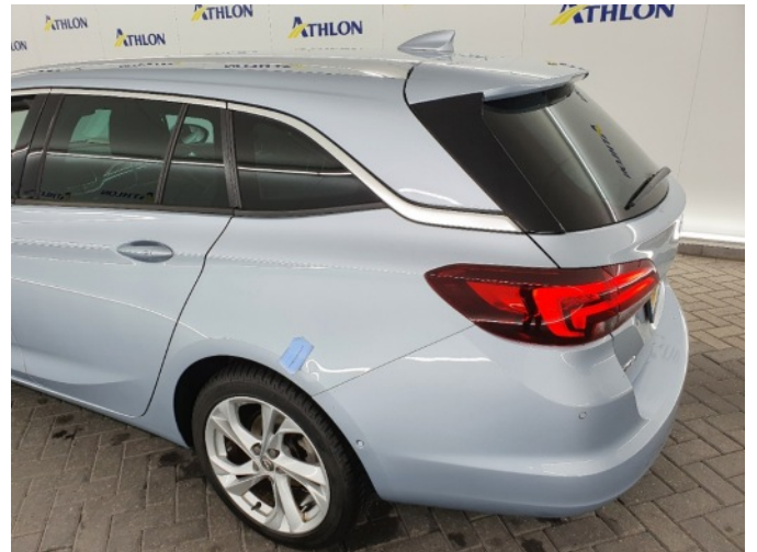
1. Zijwand - achter - Links