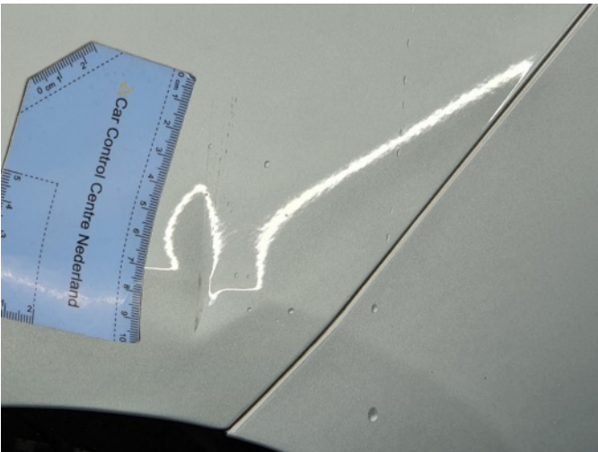
1. Zijwand - achter - Links