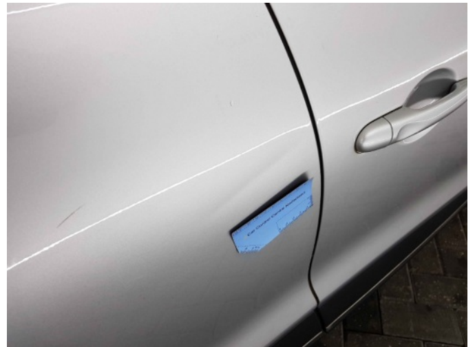
1. Portier achter - rechts