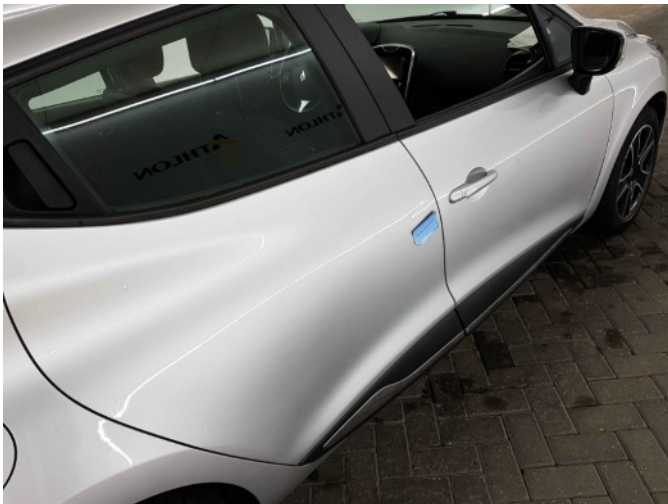
1. Portier achter - rechts