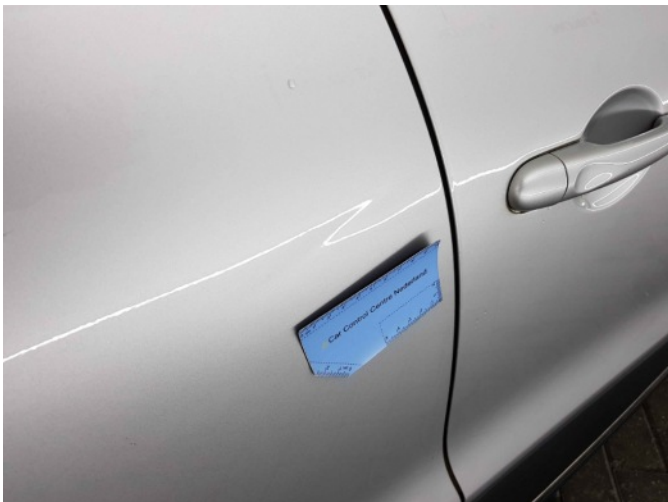
1. Portier achter - rechts