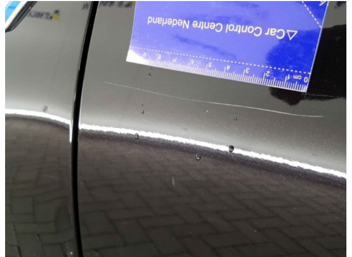
2. Portier voor - links