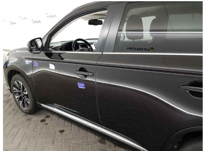
2. Portier voor - links