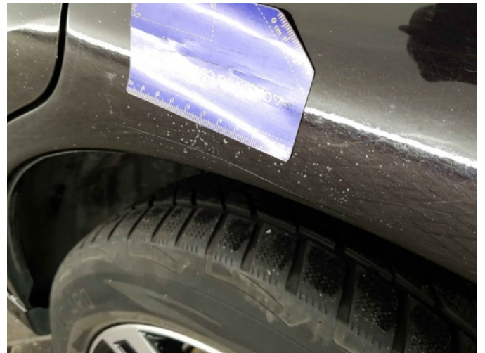
1. Zijwand - achter - Links