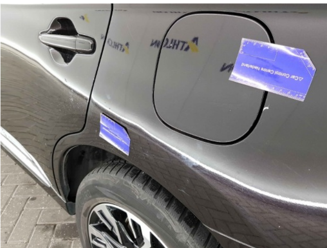
1. Zijwand - achter - Links