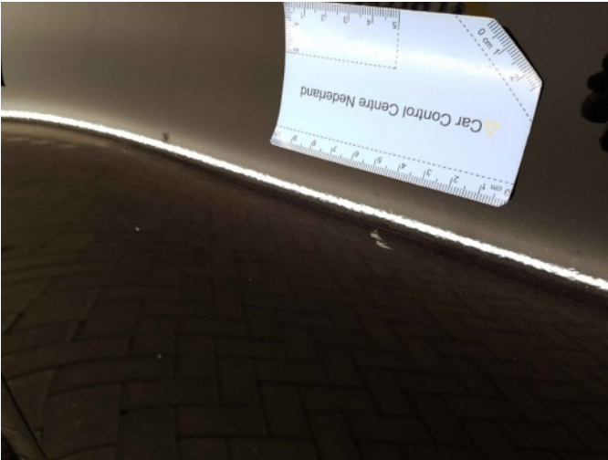
2. Portier voor - links