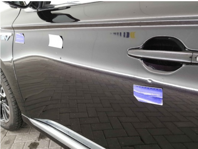
2. Portier voor - links