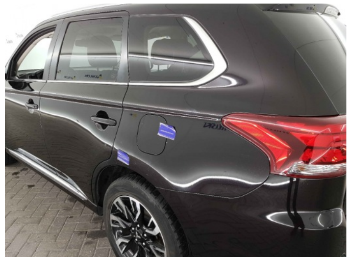
1. Zijwand - achter - Links