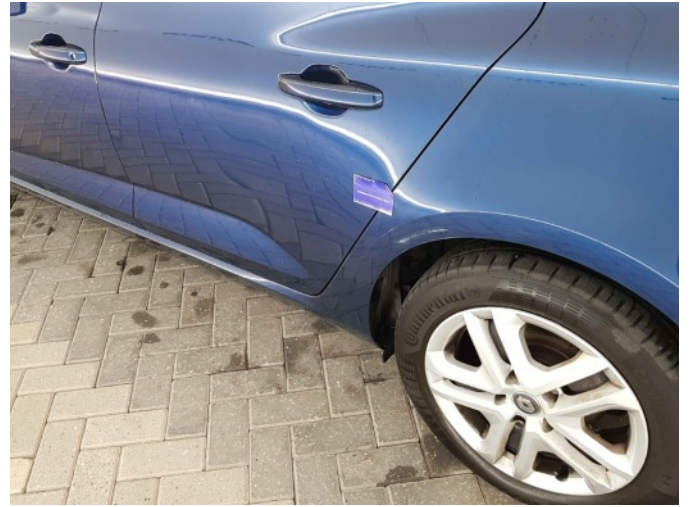
2. Zijwand - achter - Links