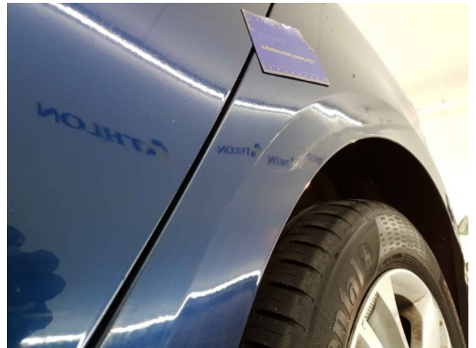
2. Zijwand - achter - Links