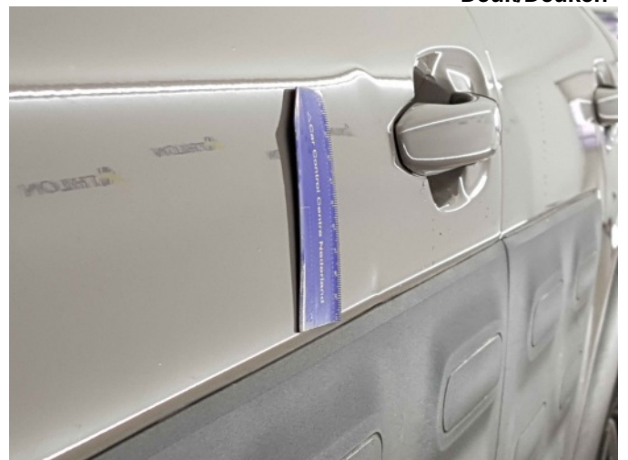
2. Portier voor - links