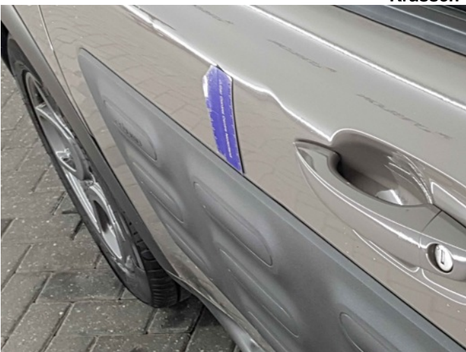
2. Portier voor - links