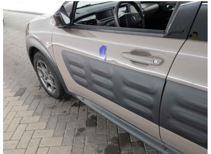
2. Portier voor - links