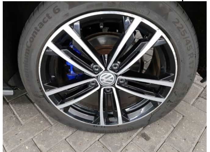
2. Velg voor - rechts