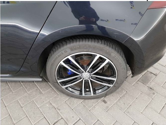
2. Velg voor - rechts