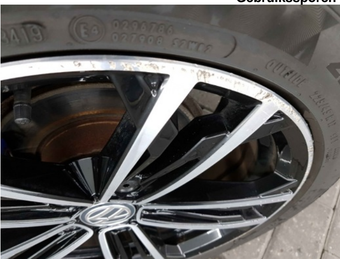
2. Velg voor - rechts