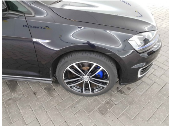
2. Velg voor - rechts