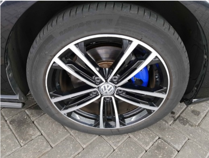
2. Velg voor - rechts