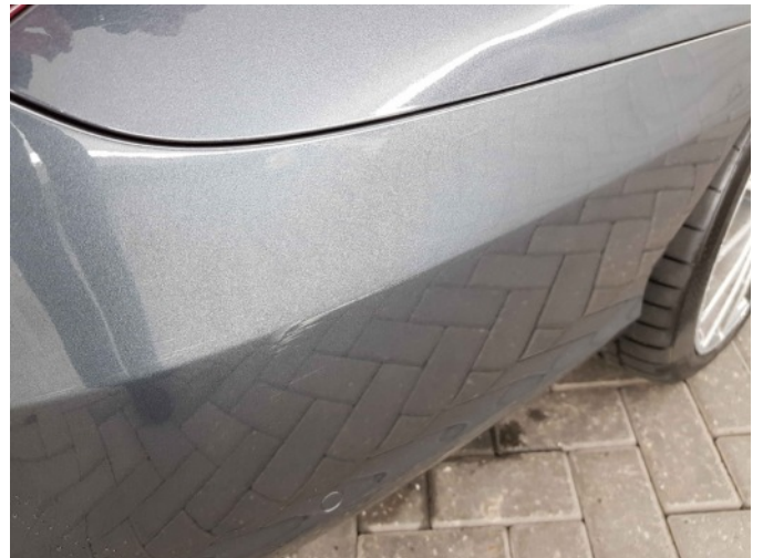
1. Zijwand - achter - rechts