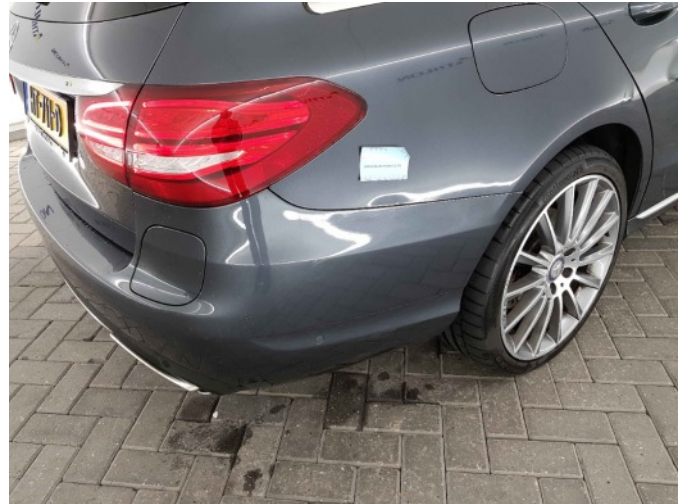
1. Zijwand - achter - rechts