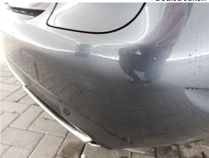
1. Zijwand - achter - rechts