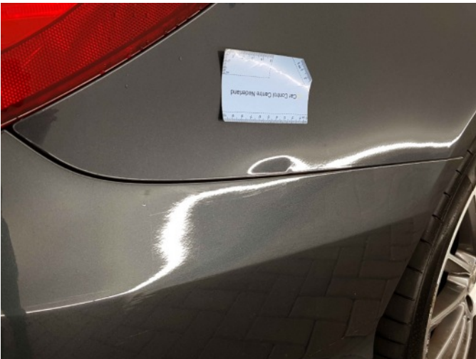
1. Zijwand - achter - rechts