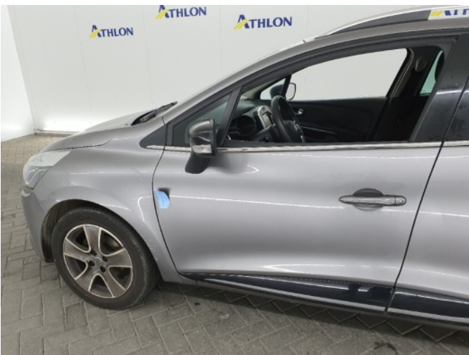
1. Portier voor - links