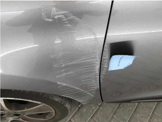
1. Portier voor - links