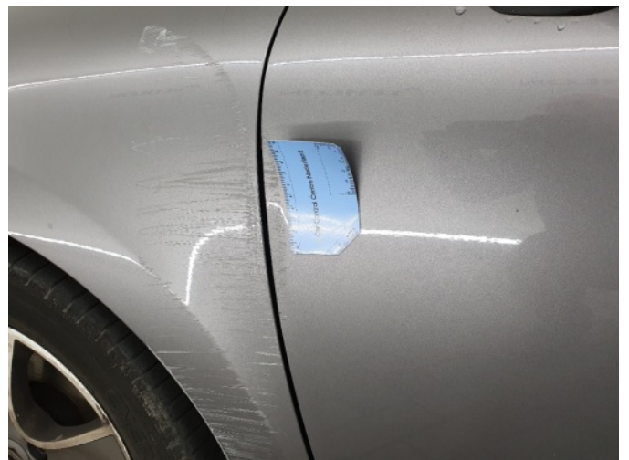
1. Portier voor - links