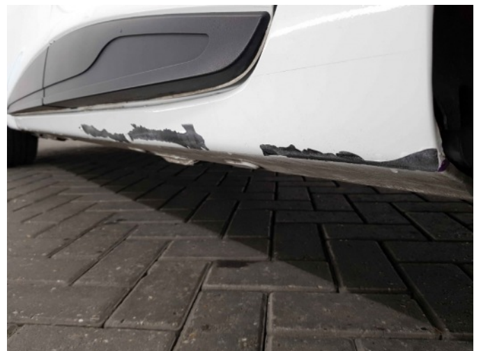
1. I dorpel lakonthechting