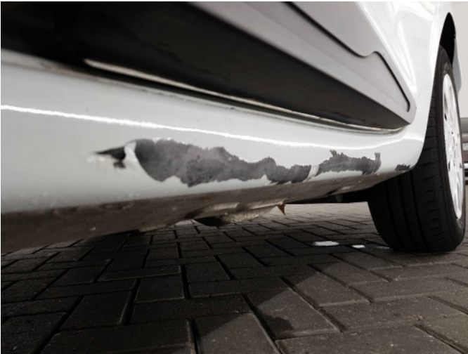
1. I dorpel lakonthechting