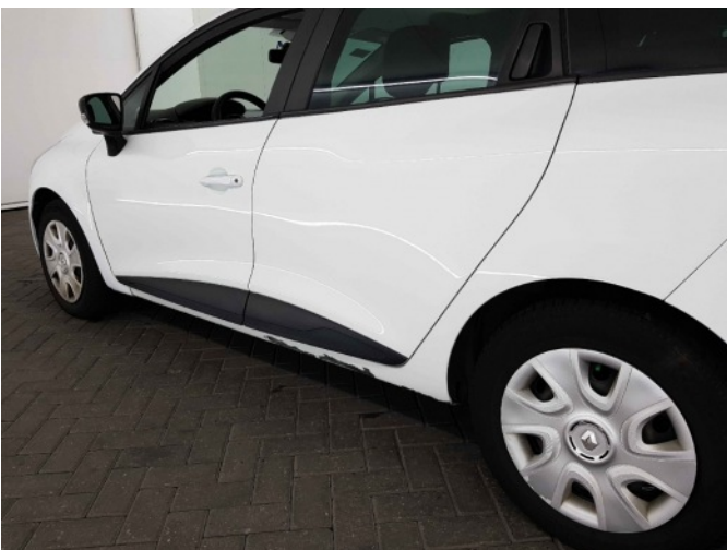
1. I dorpel lakonthechting