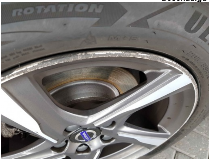
4. Velg achter- rechts