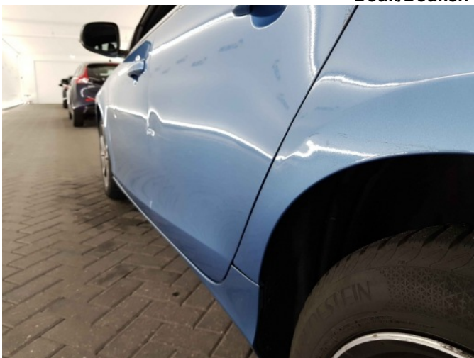
7. Portier achter - links