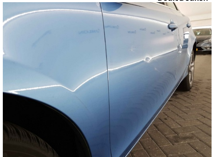
7. Portier achter - links