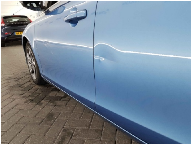
7. Portier achter - links