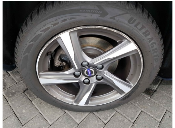
4. Velg achter- rechts