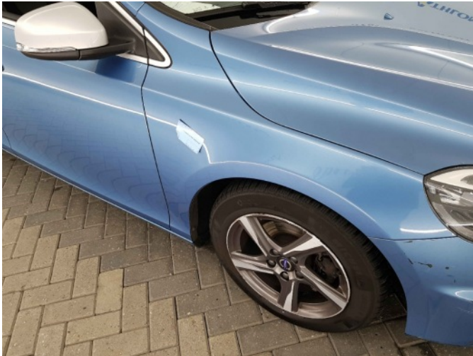
3. Spatbord voor- rechts