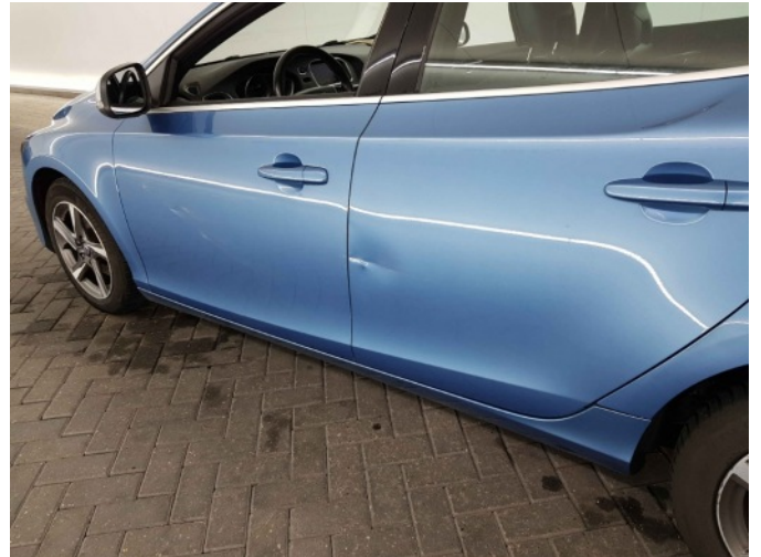
7. Portier achter - links