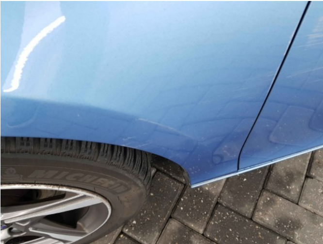
7. Portier achter - links