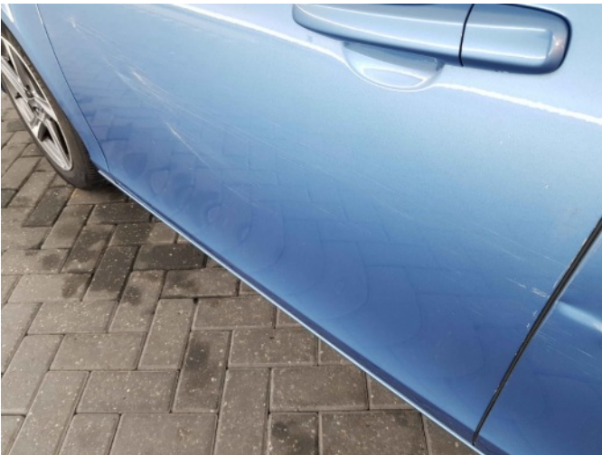
7. Portier achter - links