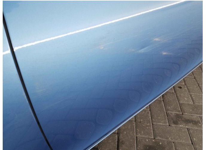
7. Portier achter - links