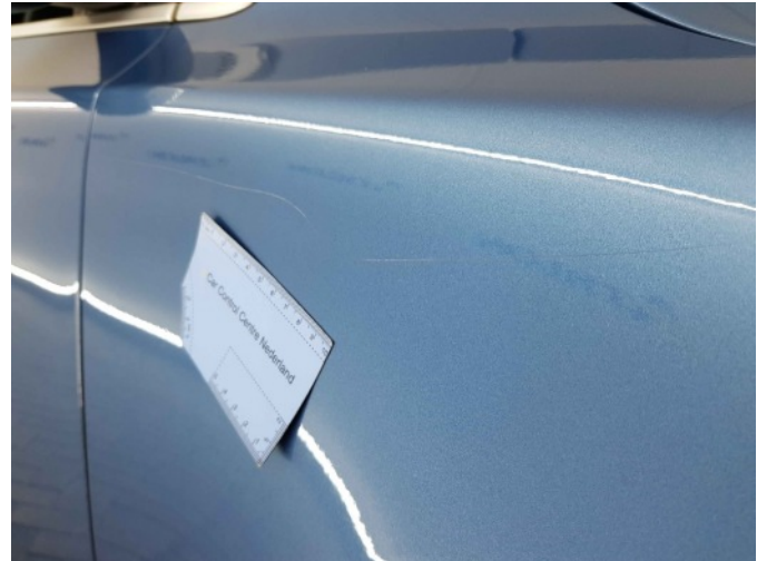
3. Spatbord voor- rechts