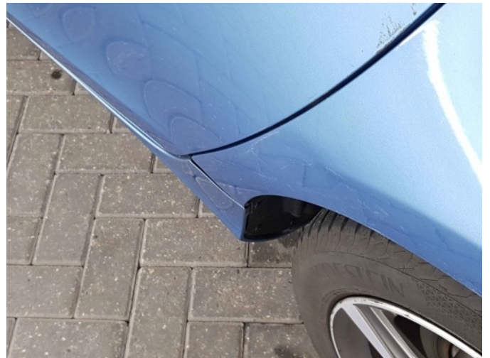
7. Portier achter - links