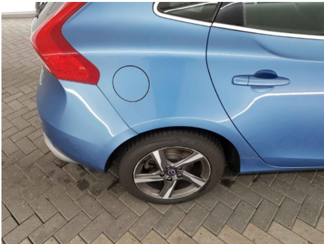
4. Velg achter- rechts