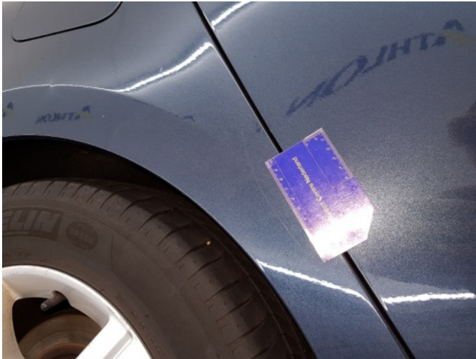
2. Zijwand - achter - rechts