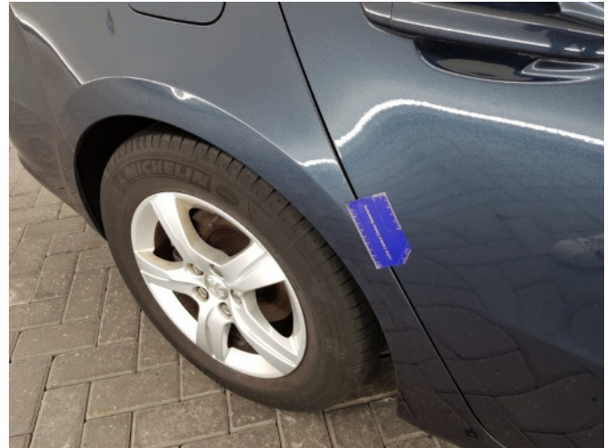
2. Zijwand - achter - rechts