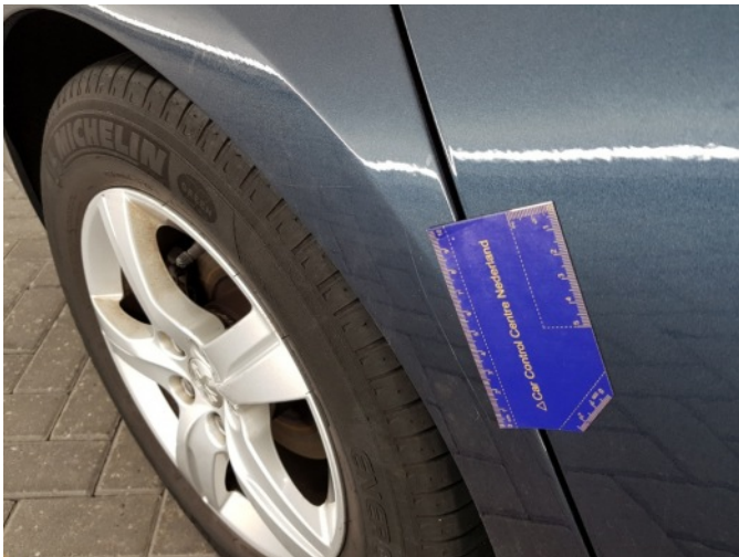
2. Zijwand - achter - rechts