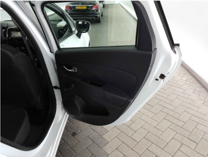
1. Interieur diverse