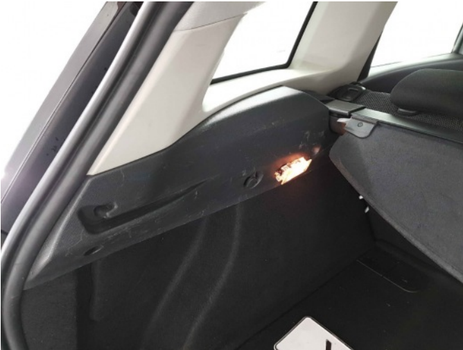
1. Interieur diverse