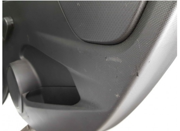
1. Interieur diverse