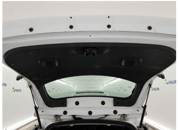
1. Interieur diverse