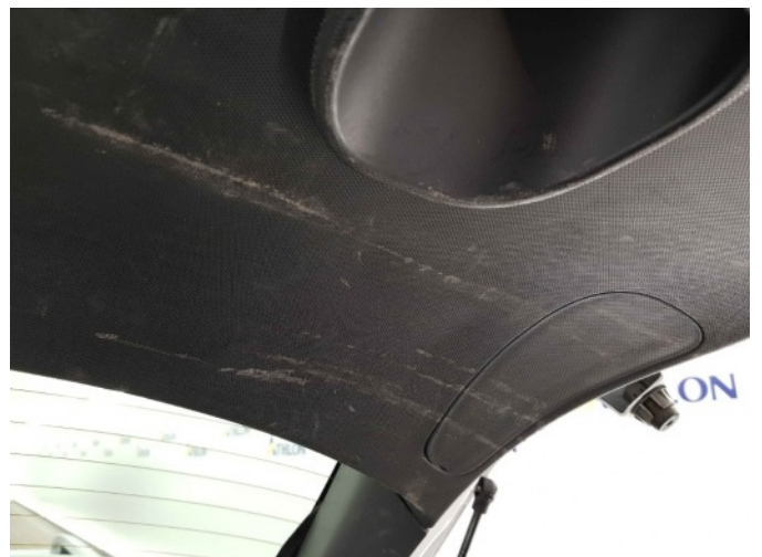
1. Interieur diverse