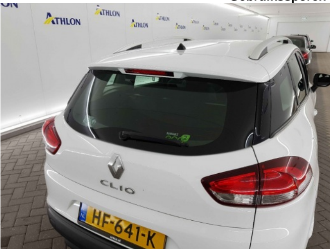
3. Afdekkap ruitenwisser achterzijde