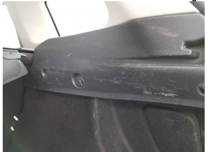
1. Interieur diverse