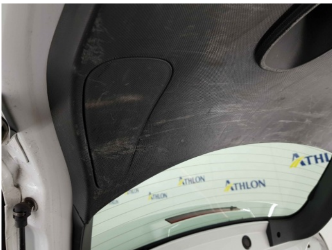
1. Interieur diverse