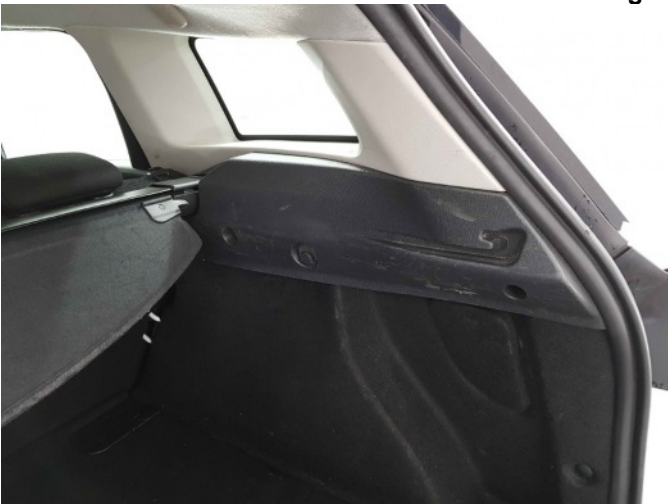
1. Interieur diverse