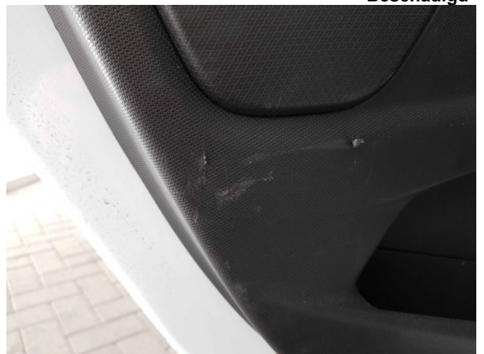
1. Interieur diverse