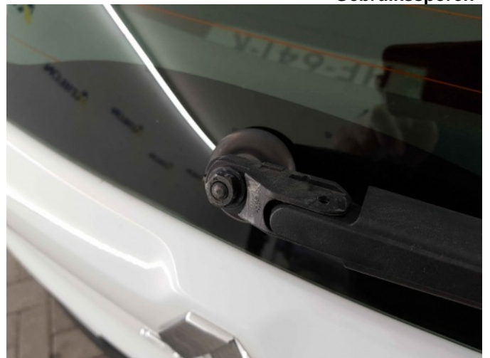
3. Afdekkap ruitenwisser achterzijde