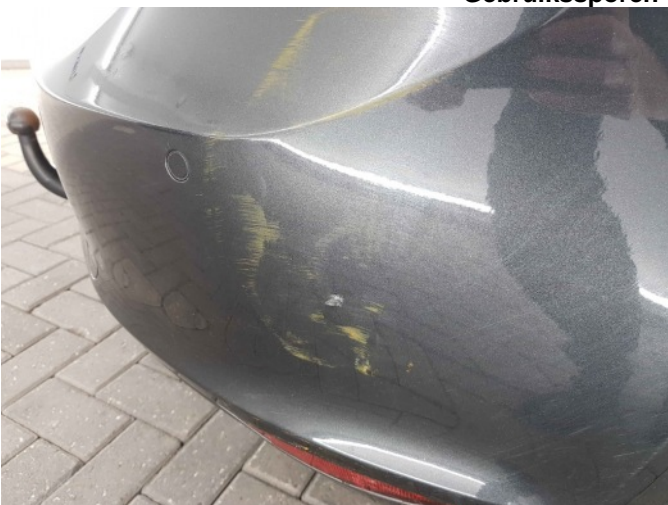
3. Intern transport schade