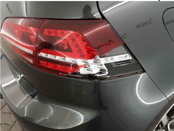
3. Intern transport schade