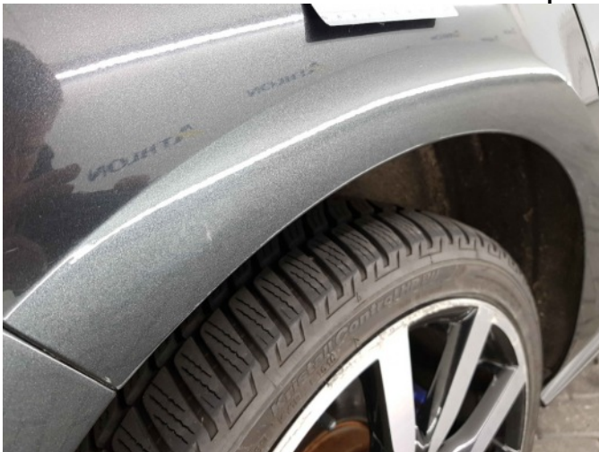
1. Zijwand - achter - rechts