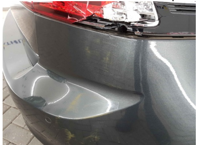
3. Intern transport schade