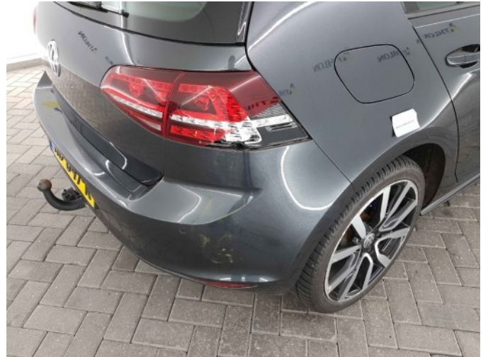
3. Intern transport schade