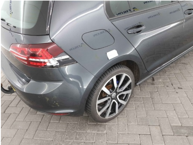
1. Zijwand - achter - rechts