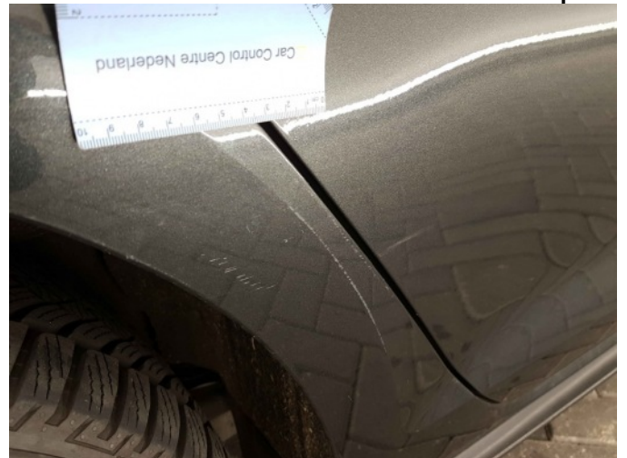
1. Zijwand - achter - rechts