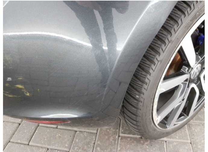
1. Zijwand - achter - rechts