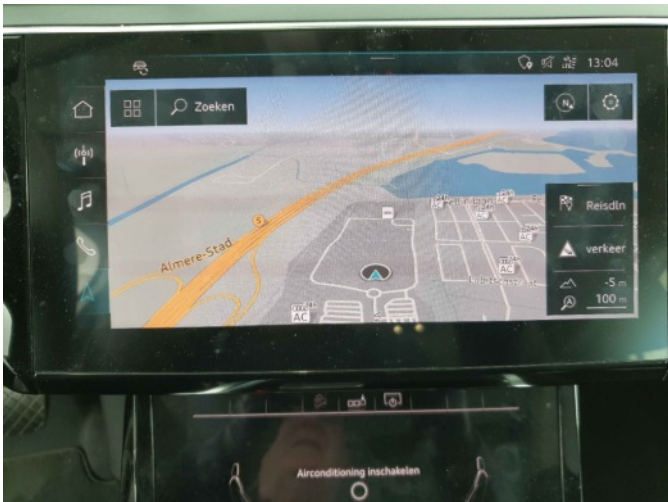
Navigatie of radio