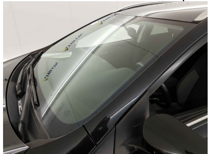
2. Chemische aanslag