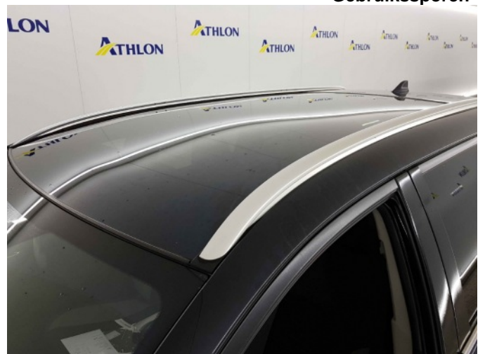
2. Chemische aanslag