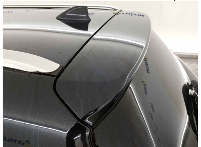
2. Chemische aanslag