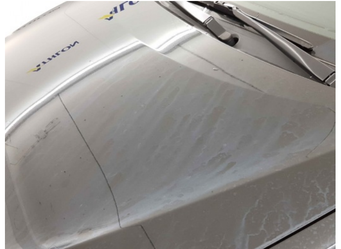
2. Chemische aanslag