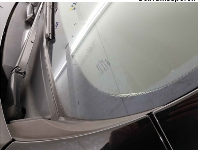
2. Chemische aanslag