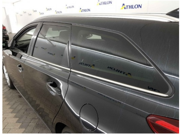
2. Chemische aanslag