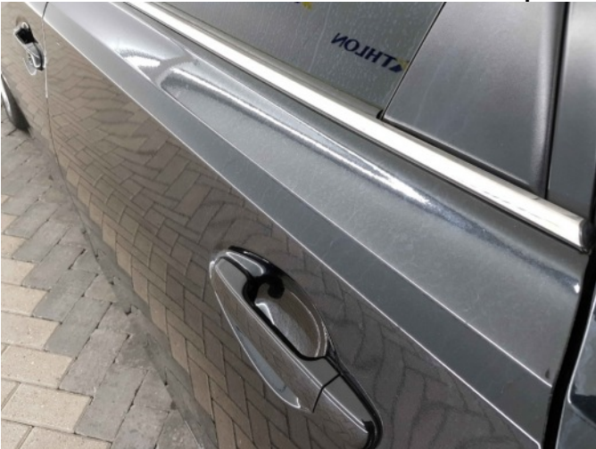
2. Chemische aanslag