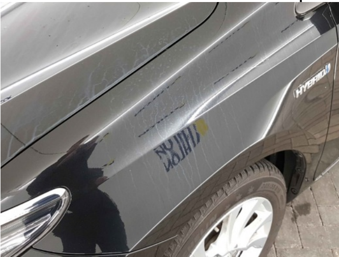
2. Chemische aanslag