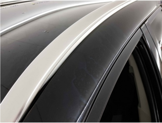
2. Chemische aanslag