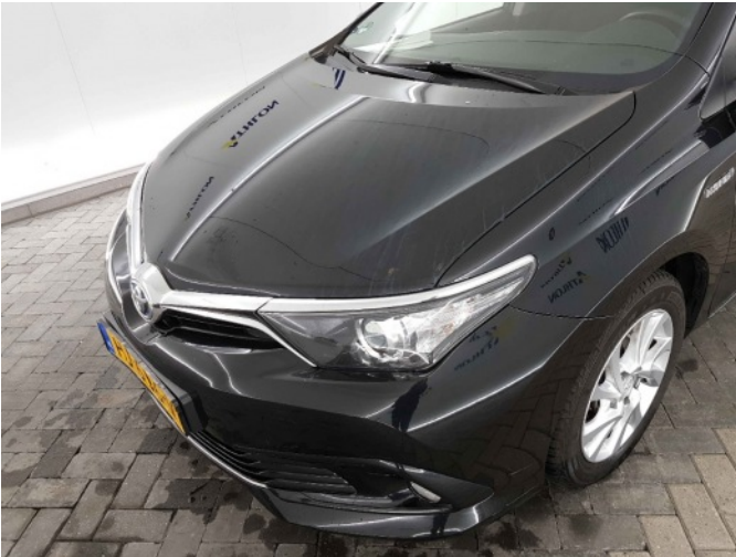
2. Chemische aanslag