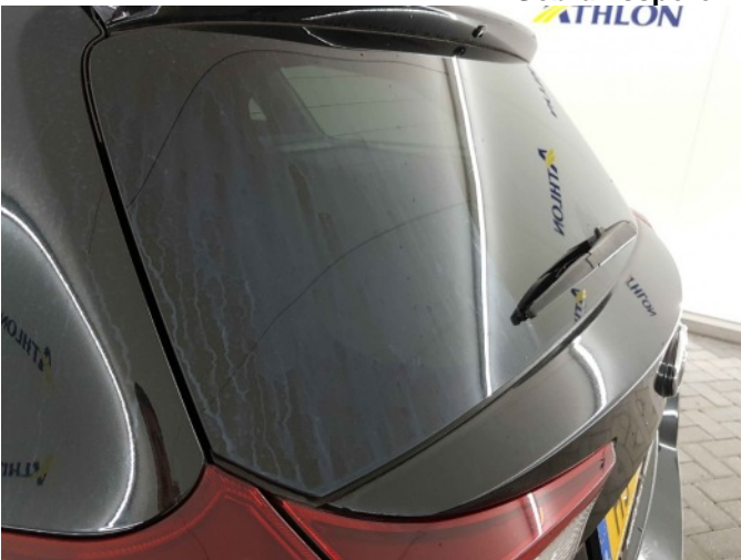
2. Chemische aanslag